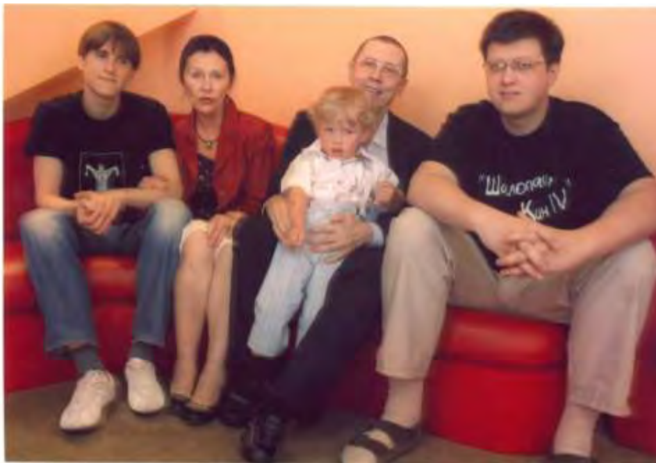
В. С. Золотухин с семьей