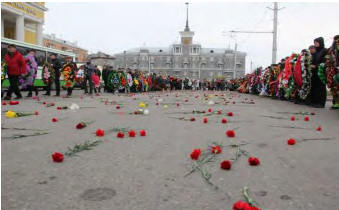
Прощание с актером в Барнауле на площади Октября

Могучее сердце Валерия Сергеевича перестало биться 30 марта 2013 года. В Москве в Театре на Таганке в этот день отменили спектакли. В Барнауле в Молодежном театре Алтая прошла гражданская панихида. Валерий Сергеевич Золотухин похоронен на своей малой родине – в селе Быстрый Исток Алтайского края.