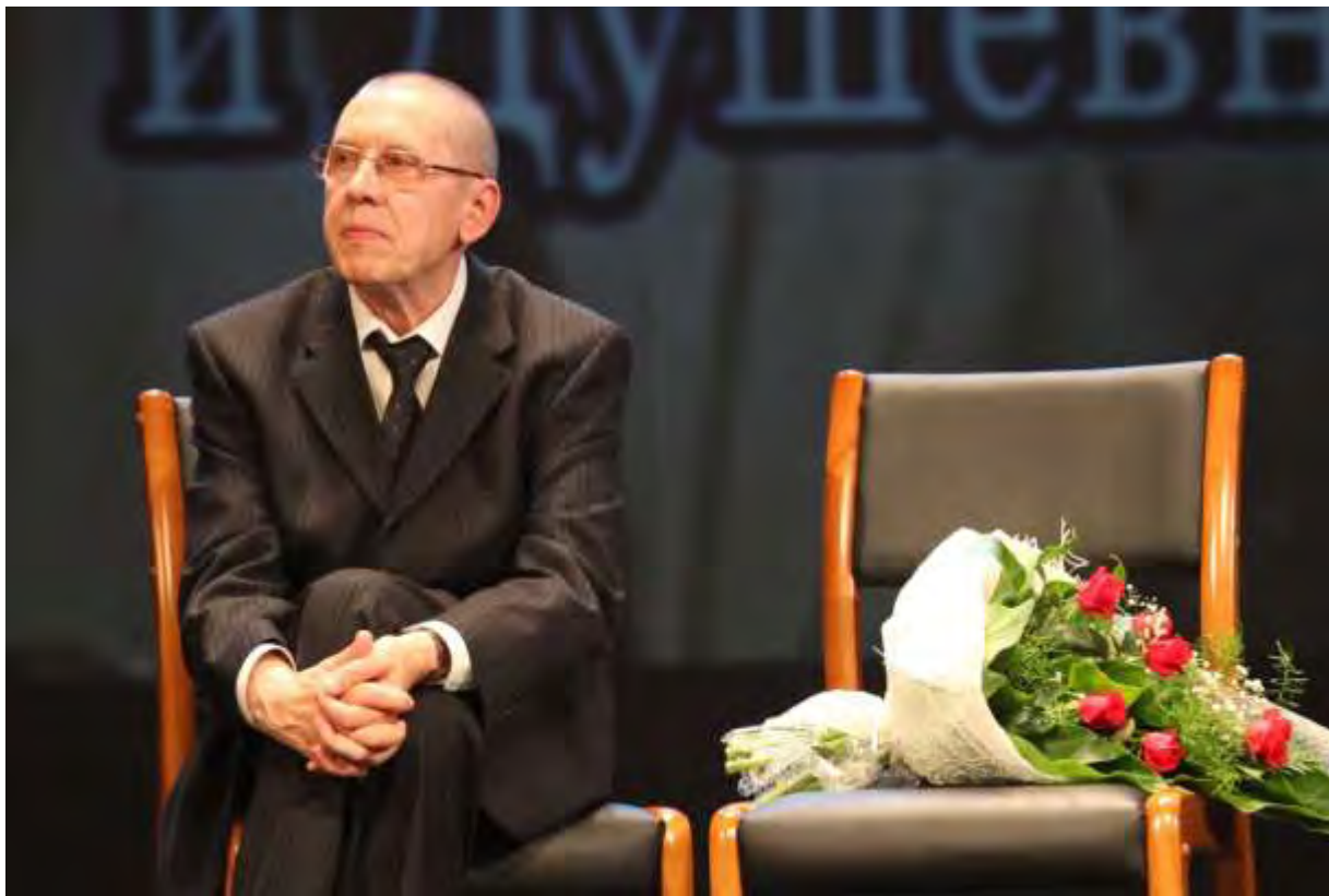
В. Золотухин на сцене Молодежного театра Алтая

Его последний спектакль «С любимыми не расставайтесь» состоялся в Барнауле, на сцене Молодежного театра Алтая 24 ноября 2013 года, на том самом месте, где в 1957 году он вел концерт на сцене БМК.