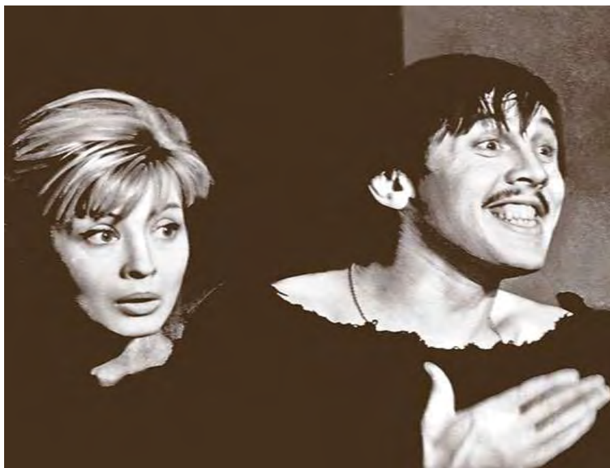
Валерий Золотухин и Нина Шацкая в "Добром человеке из Сезуана"

С 1964 года стал его актёром, дебютировав в роли водоноса Ванга в спектакле «Добрый человек из Сезуана». Некоторое время спустя стал в этом театре одним из самых ярких и интересных актёров.