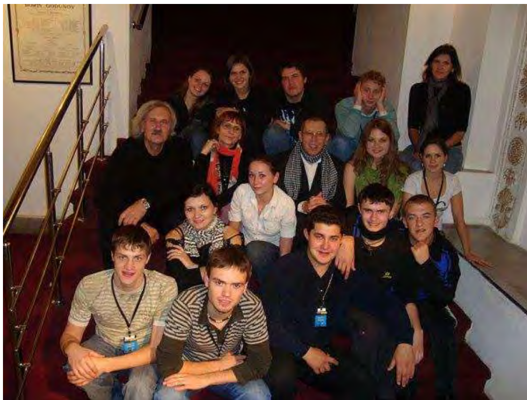
В. Золотухин среди студентов АлтГАКИ

В этом спектакле была задействована вся молодежь, от первого до четвертого курса театрального отделения АлтГАКИ. Золотухин был рад работать с молодыми актерами.