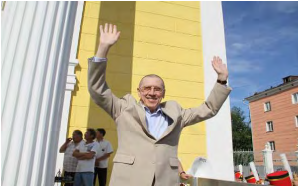
В. Золотухин на церемонии открытия театра

Когда отгремели поздравительные речи и слово дали ему, худруку театра и человеку, Золотухин перекинул ногу через барьер ложи и просто прыгнул вниз. <...>Золотухин взбежал на сцену, оказался среди своей молодежи, взял микрофон и запел: «Ничего! Ничего! Ничего! Сабля, пуля, штыки – все равно!»