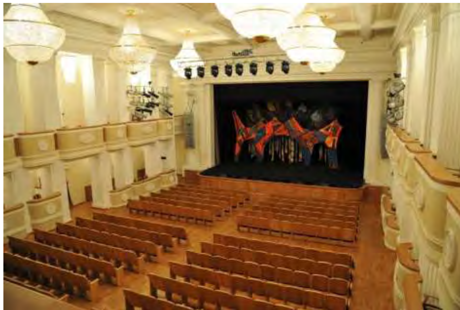
Сцена и зал реконструированного здания театра

Долгое время работы велись под тем самым занавесом, которым было накрыто здание. 18 октября 2010 года занавес сняли – и Барнаул ахнул! Люди не могли наглядеться. Даже те, кто помнили его в 1980-е, не видели его таким.