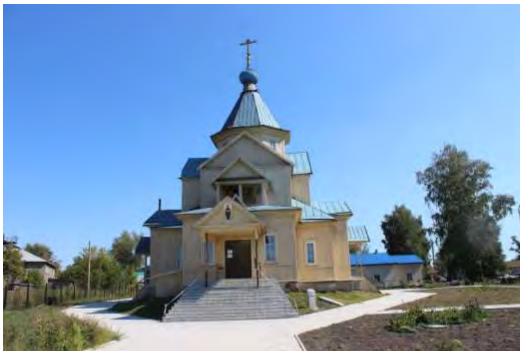
Возрожденный храм в Быстром Истоке

Все, к кому он обращался, не отказывали в помощи.