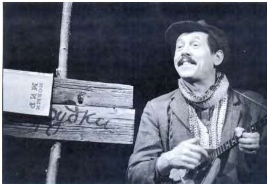
Спектакль «Живой» — главная роль Валерия Золотухина в Театре на Таганке