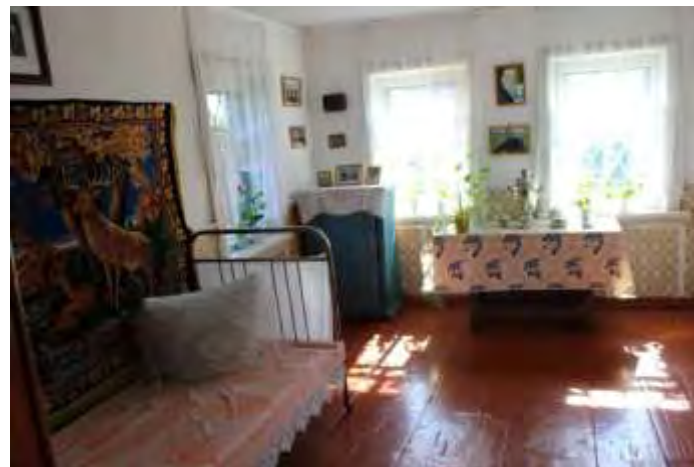
Дом, куда семья Золотухиных переехала после возвращения Валерия из Чемала. Ныне – мемориальный музей.