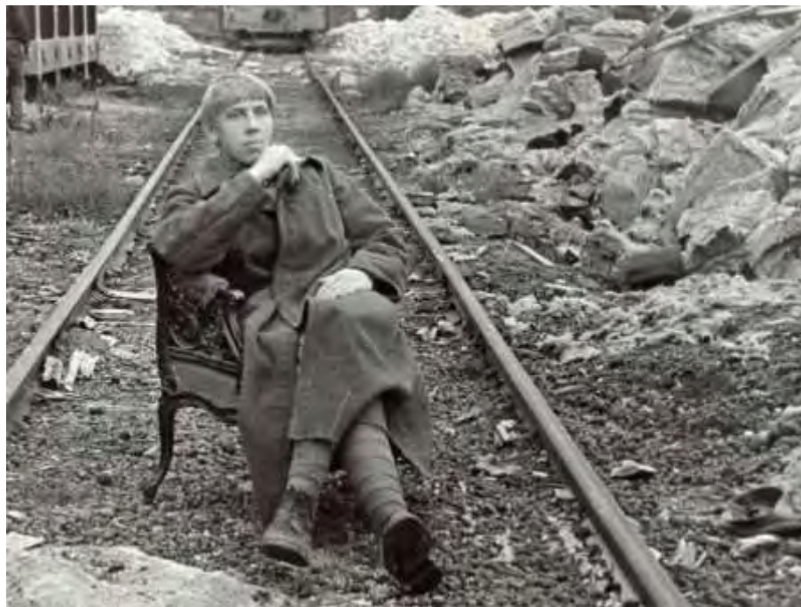
В. Золотухин во время съемок фильма «Бумбараш»

30 мая 2013 года Алтайскому государственному театру для детей и молодежи присвоено имя народного артиста РСФСР и художественного руководителя Молодежного театра Алтая Валерия Сергеевича Золотухина.