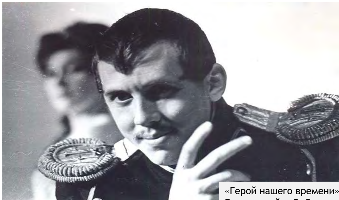
«Герой нашего времени» Театр на Таганке Грушницкий – В. Золотухин 1964 г.

С октября 2011 по март 2013 года был художественным руководителем Театра на Таганке.