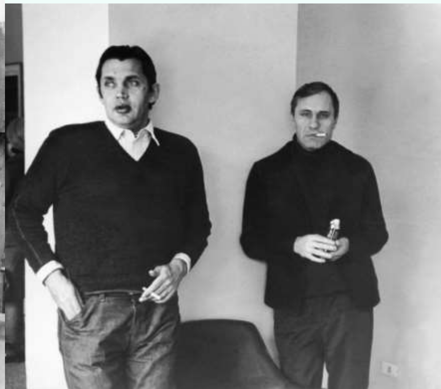
Рождественский с В. Шукшиным