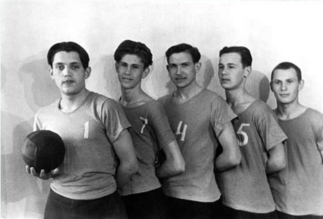
Сборная по волейболу Петрозаводского государственного университета. Роберт Рождественский — №1, 1951 г.

Роберт всегда учился на отлично. Занимался боксом, волейболом, баскетболом. Стихи писал все время. После неудачной попытки стать студентом Московского литературного института, поступил на филологический факультет Петрозаводского университета и с головой ушел в спорт.