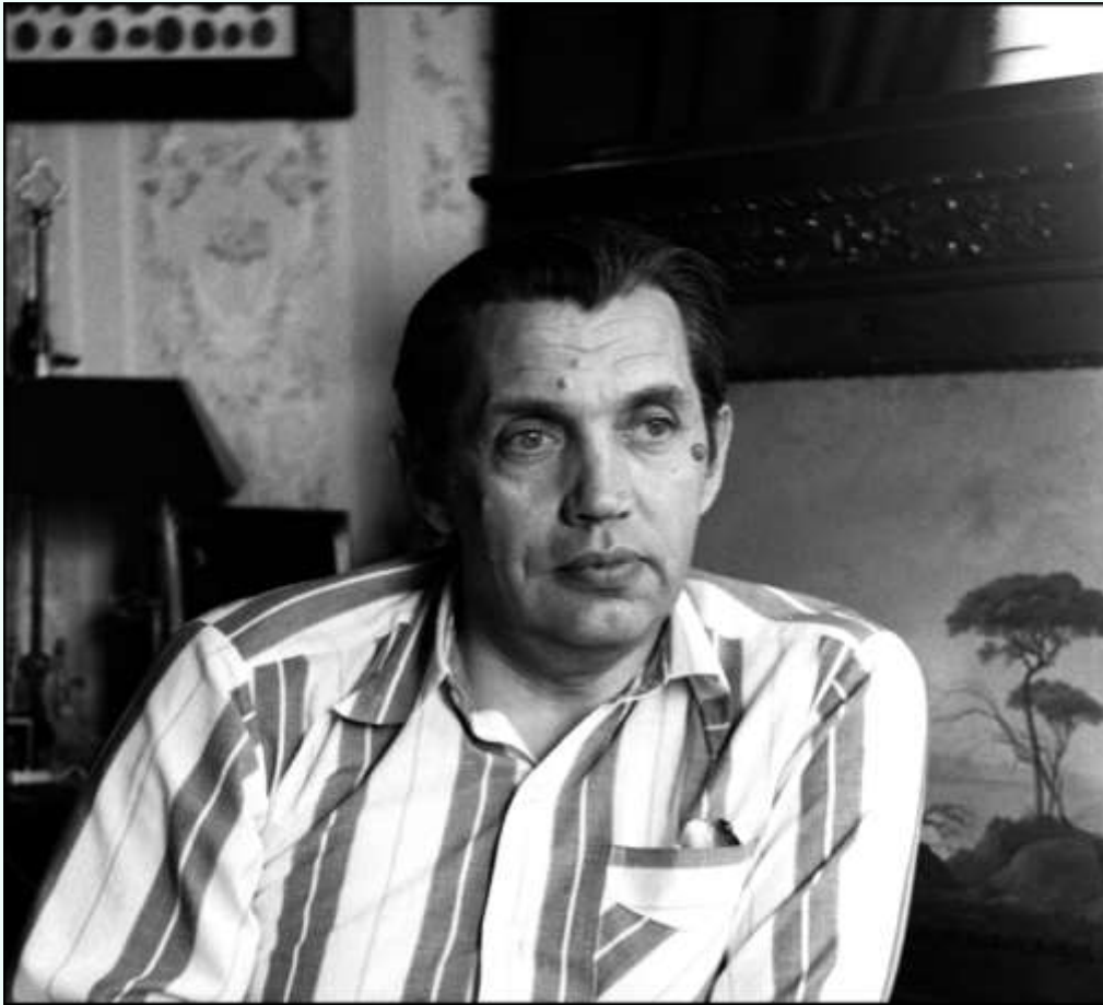
Роберт Иванович Рождественский, 1982 г.

Известный поэт, переводчик, автор множества стихов, поэм, песен.