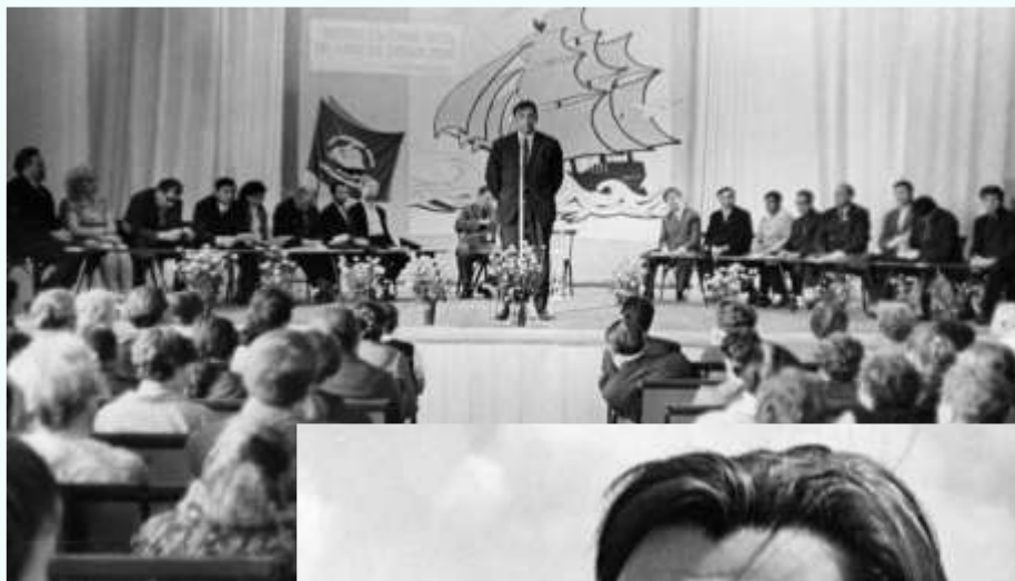
Выступление во время «Дней советской литературы на Алтае»