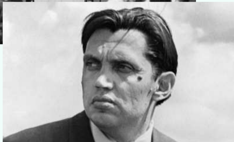
Во время «Дней советской литературы на Алтае». 1972 г.