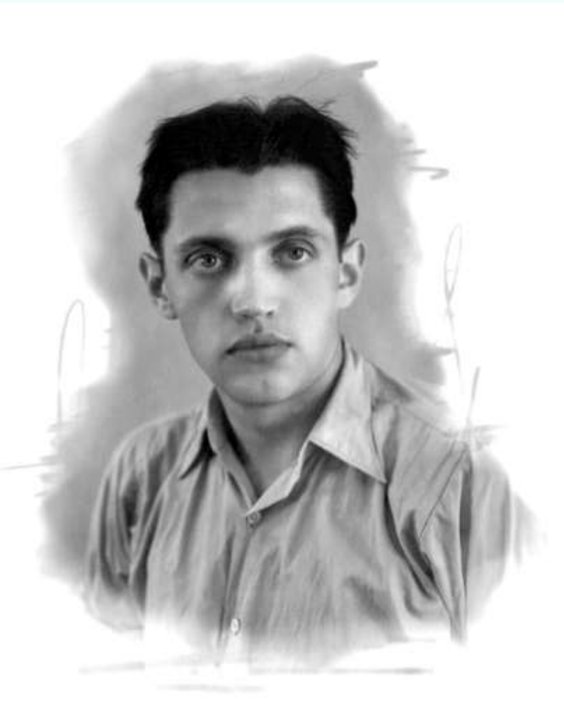
Фото сделано на практике в Барнауле, 1955 г.

Из поездки Роберт привез черновики стихов «Выбор», «Ожидание», «Речка Иня», «Рассказ директора конторы Заготзерно», «1000 мелочей», «Утро», поэмы «Совесть».