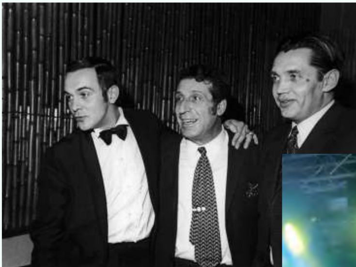
С Муслимом Магомаевым и Арно Бабаджаняном. 1972 г.

Рождественский написал не одну сотню песен. С ним работали самые известные композиторы и исполнители. И с каждым годом песен становится все больше, потому что музыку на его стихи пишут и сегодня.