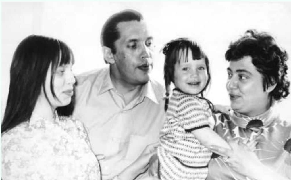
Роберт Рождественский с семьей: женой Аллой Киреевой, дочерьми Екатериной и Ксенией. Фото 1972 г.

В шестидесятые начался громовой успех поэзии. Поэты тогда стали олицетворением свободы. Но постепенно надежды шестидесятников на то, что все изменится к лучшему, угасали. И в 1968 г. рухнули. Их эпоха закончилась.