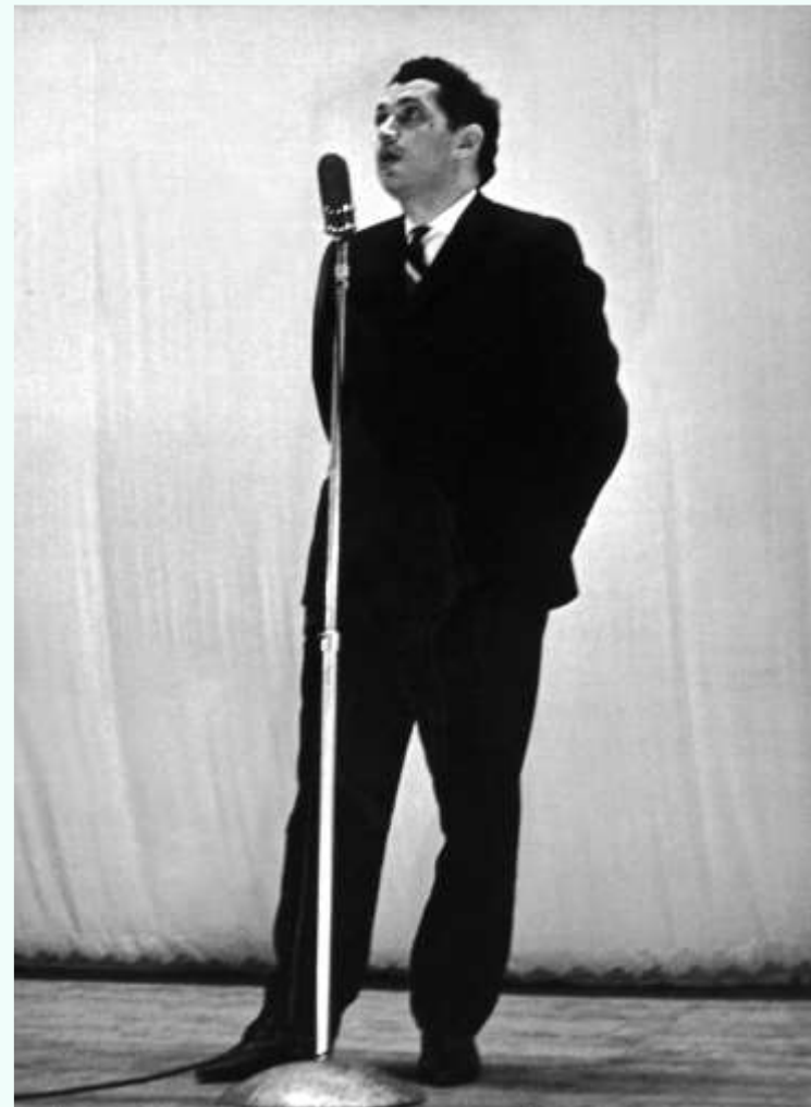
Выступление Р. Рождественского. Фото 1960-х гг.

Сборник «Дрейфующий проспект» — итог второй творческой командировки, на Северный полюс. Стихи написаны языком, которым совсем скоро поэт будет говорить со сцены с полными залами, стадионами.