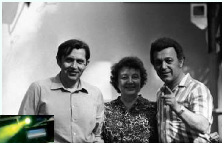
С мамой Верой Павловной и Иосифом Кобзоном. 1982 г.