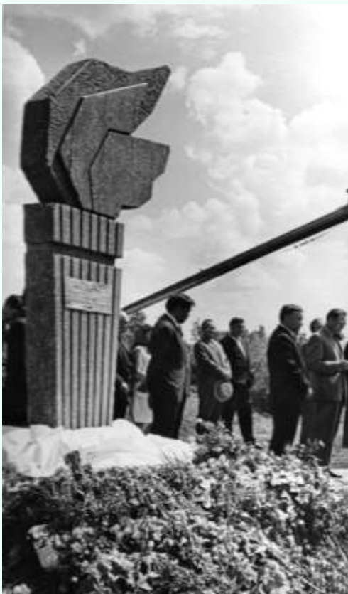
Открытие памятного знака «Алтай-Белоруссия», Тальменский район, «Дни советской литературы на Алтае»