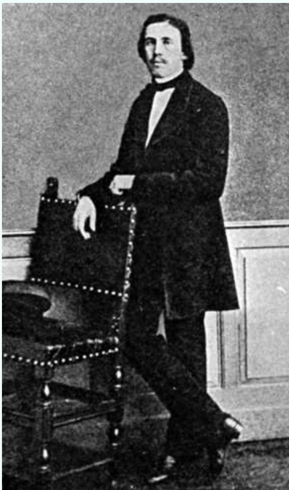
Н. М. Ядринцев. 1860-е годы