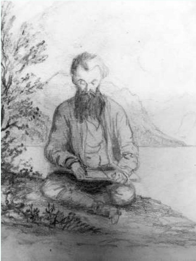
Карандашный автопортрет Н. М. Ядринцева, рубеж 1870-1880-х годов

В мае 1878 года Николай Ядринцев отправился в свою первую экспедицию на Алтай как член Русского географического общества.