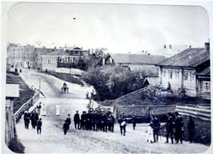
г. Шенкурск. Конец XIX в. Место ссылки Н. М. Ядринцева

Осенью 1863 года Ядринцев вернулся в Сибирь. Сначала в Омск, затем – в Томск.