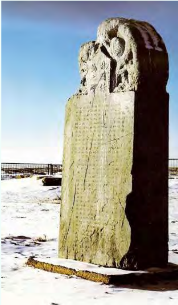
Орхонские надписи. Датируются VII–XI вв.