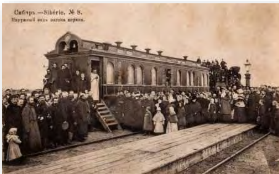
На ступенях вагона - святитель Макарий (Невский)

1 декабря 1912 г. указом Святейшего Синода архиепископ Макарий (Невский) был назначен митрополитом Московским и Коломенским. Новая жизнь в столице не изменила отца Макария. Он, как и всегда и всюду отличался преданностью вере и России.