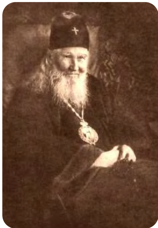
Изгнание. Последние годы жизни

К 1917 г. события в России стали разворачиваться с калейдоскопической быстротой. Произошло убийство Распутина, отречение царя от престола и приход к власти Временного правительства.