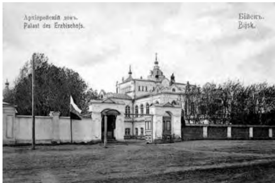
Бийск. Архиерейский дом

29 августа 1880 года , в дни празднования 50-летия Алтайской духовной миссии, в Бийске архимандритом Владимиром (Петровым) закладывается основа нового центра Алтайской духовной миссии, и начинается строительство архиерейского подворья. Здесь, в Бийске, архимандрит Владимир станет первым викарием и епископом Бийским, а сана архимандрита в 1883 г.