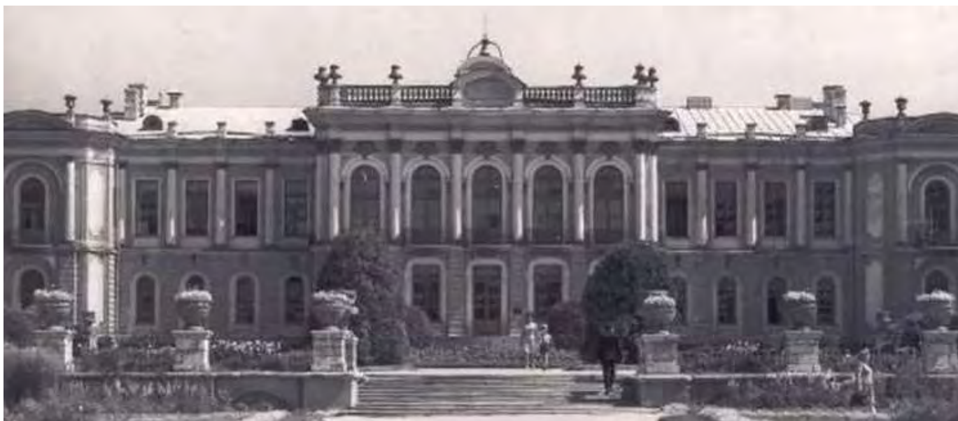
Здание Тимирязевской академии . Начало 1930-х годов