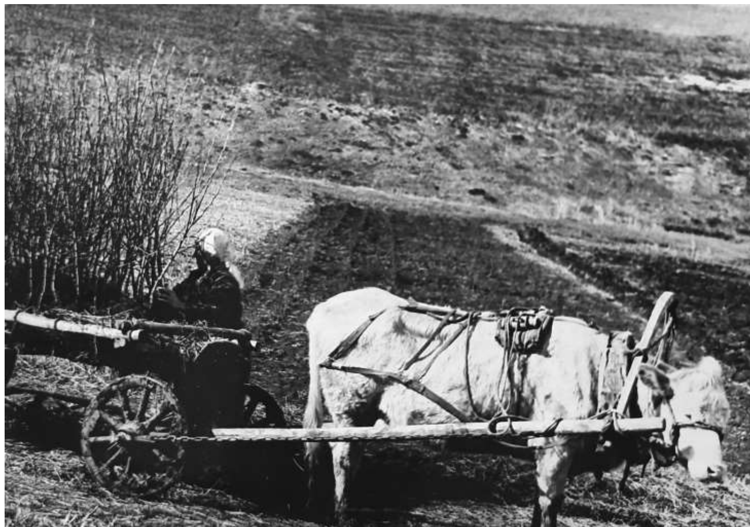
Опорный пункт. Саженцы везут на телеге, запряженной коровой. Ойротская автономная область. 1941-1945 годы.