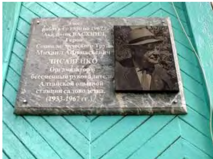
Памятная доска М. А. Лисавенко на здании Алтайской опытной станции садоводства (Современный вид)

К середине 1960-х годов под руководством М. А. Лисавенко эта станция располагала несколькими опорными пунктами, четырьмя питомниками и дендрарием. Площадь насаждений превысила 600 гектаров, а в год выращивалось до 2,5 миллионов саженцев.