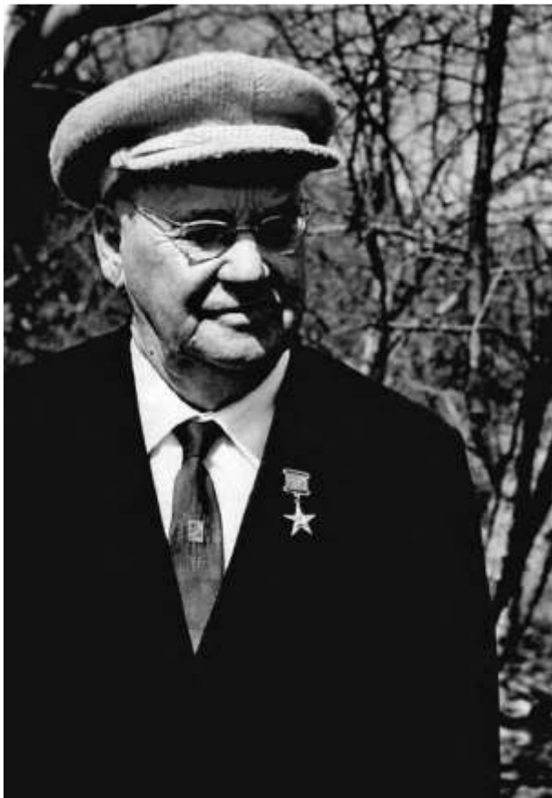
М. А. Лисавенко. 1960-е годы