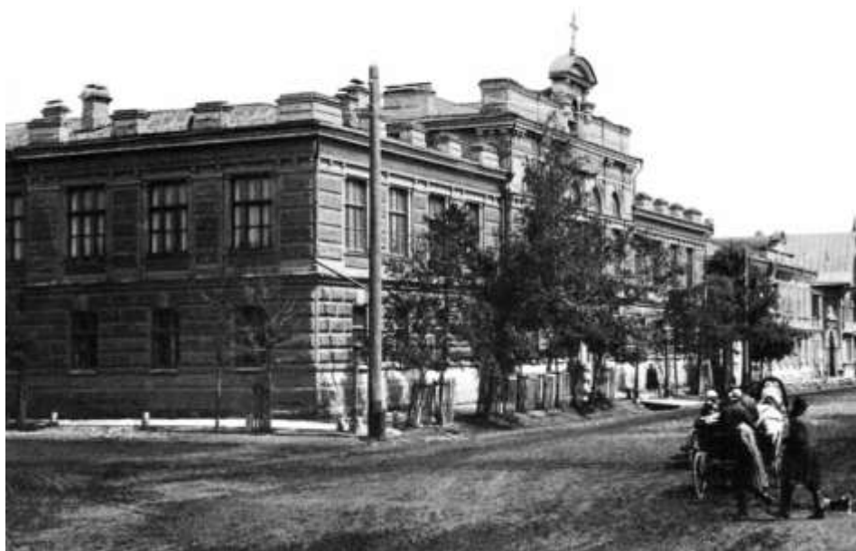
Красноярская губернская гимназия. Первое десятилетие XX в.