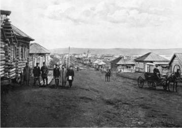
Село Боготольский Завод. Начало XX в.