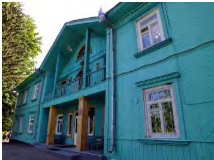
Здание Алтайской опытной станции садоводства (Современный вид)

К 1943 году опорный пункт был преобразован в плодово-ягодную станцию. В 1950 году она переместилась в город Барнаул и получила статус Алтайской опытной станции садоводства.