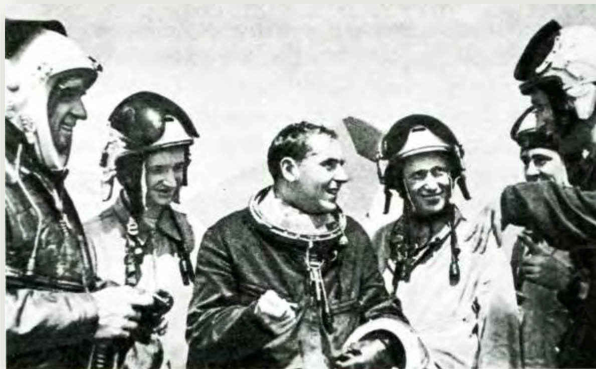
Лётчик-испытатель Герман Титов после полёта

После первого суточного орбитального полёта Герман Степанович остался служить в Центре подготовки космонавтов. Началась активная работа в качестве инструктора-космонавта и летчика-испытателя.