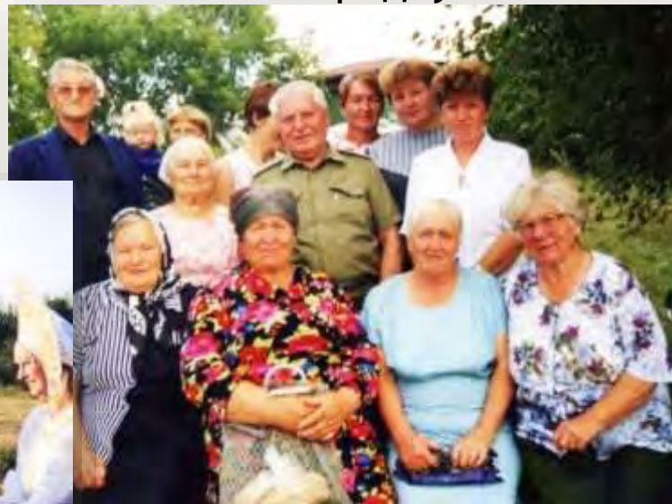
С односельчанами, село Полковниково, август 2000 год