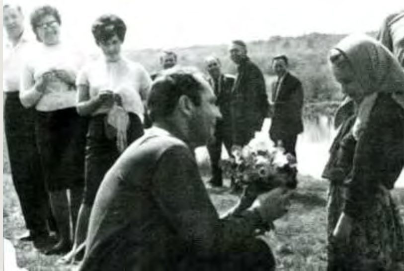
Цветы от землячки, 1965 год