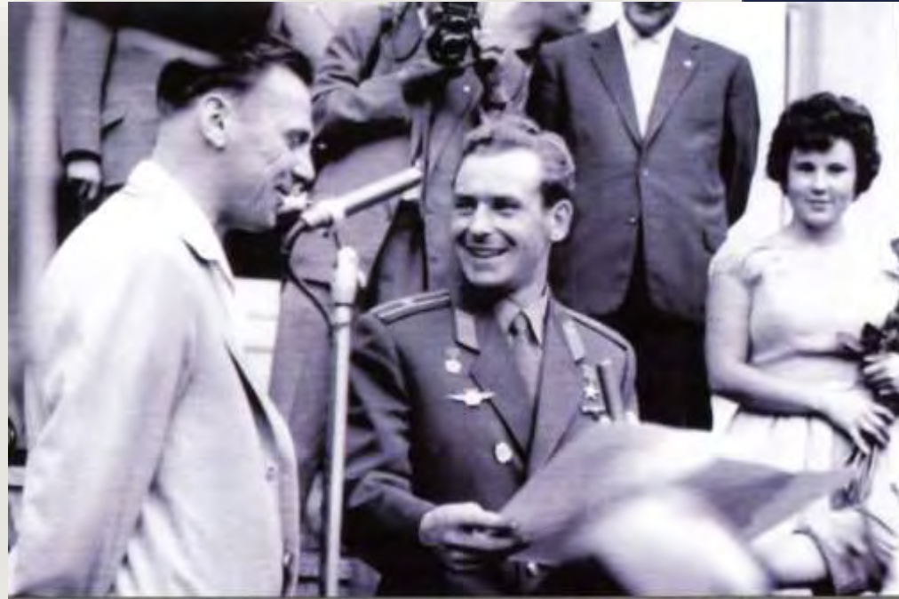
Визит в ГДР, сентябрь 1961 года