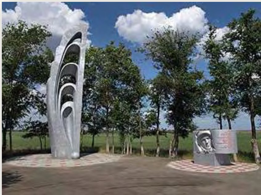
Памятный знак на месте приземления Г.С. Титова

Спускаемый аппарат с космонавтом Титовым приземлился в районе села Красный Кут Саратовской области.