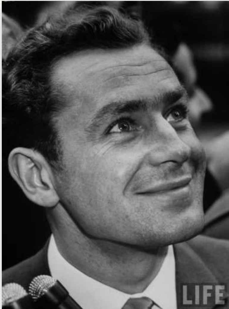
На пресс-конференции в США.