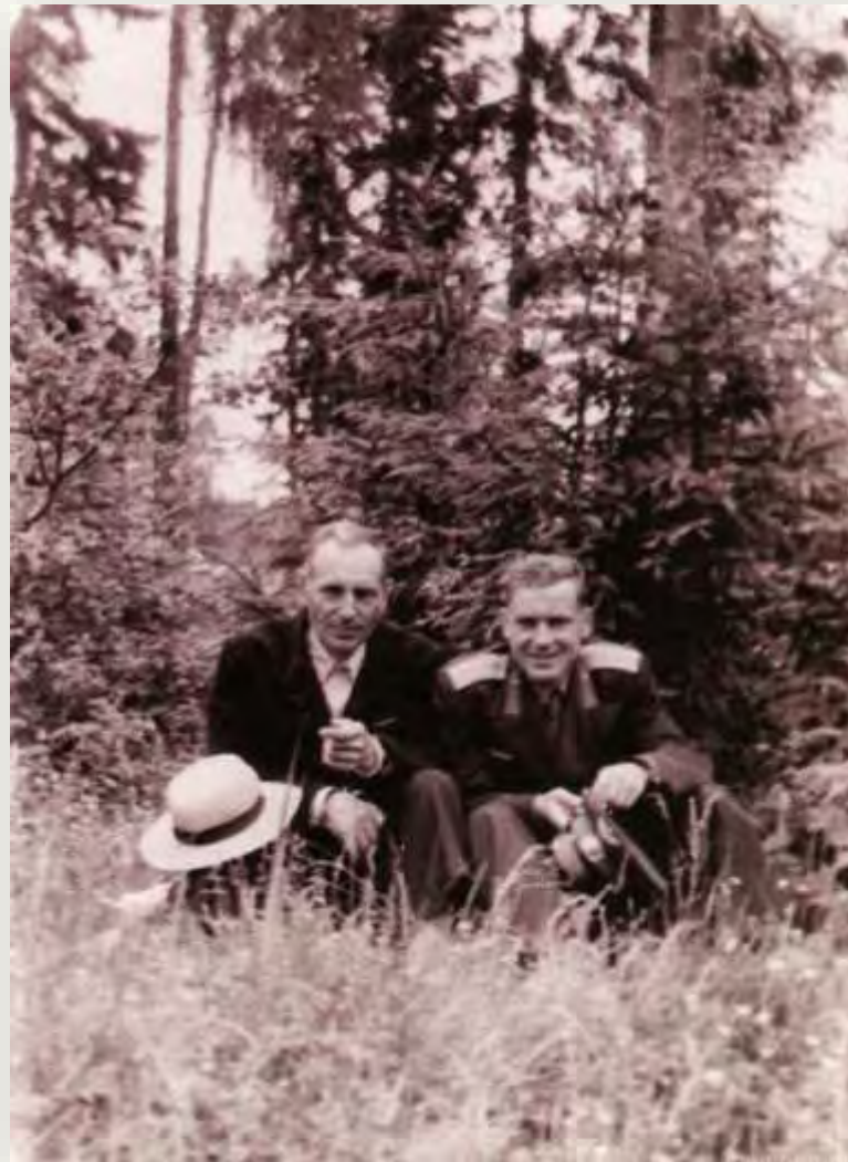
Герман Титов с отцом после окончания лётного училища

В 1957 году Г.С. Титов, окончив училище, получил диплом с отличием и был направлен для прохождения службы в 26-й гвардейский истребительный авиационный полк 41-й истребительной авиадивизии 76-й воздушной армии в посёлок Сиверский Ленинградского военного округа.