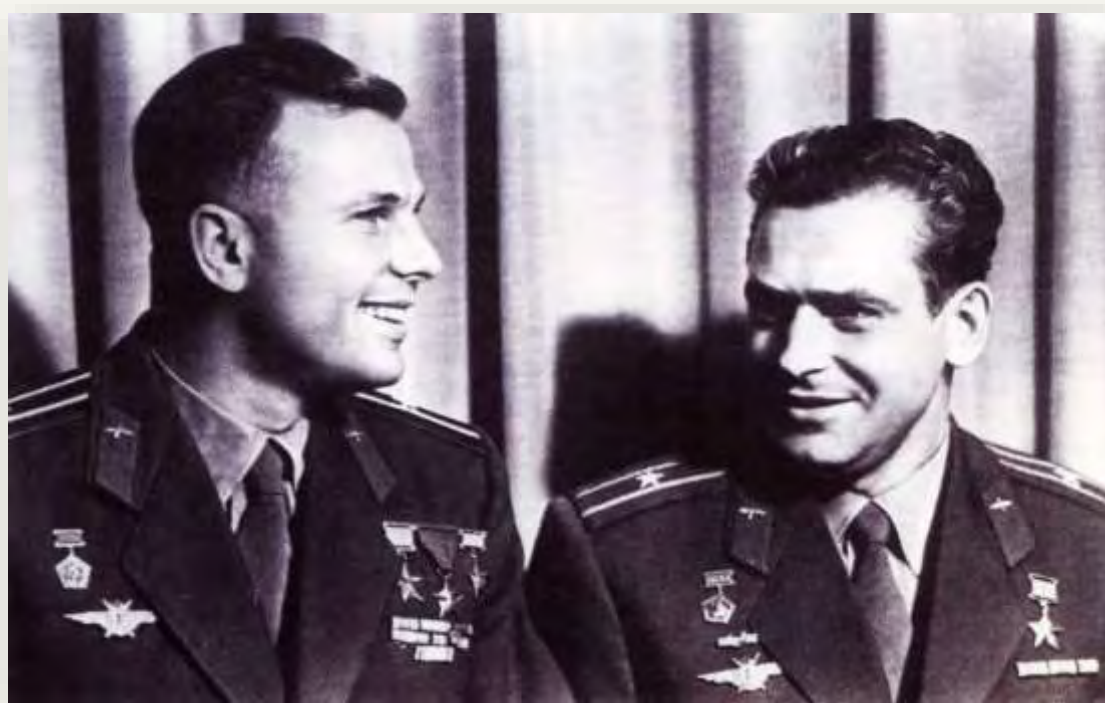
Первые космонавты Юрий Гагарин и Герман Титов, 1961 год

В 1960 году Герман Титов был включен в отряд космонавтов, и был назначен дублером Юрия Гагарина.