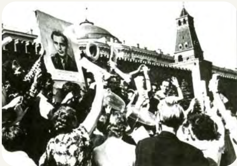
Москва встречает героя-космонавта, 9 августа 1961 года

После полета жизнь Германа Титова круто изменилась. Теперь он знаменит по всему миру. Бесконечные поездки, пресс-конференции, интервью.