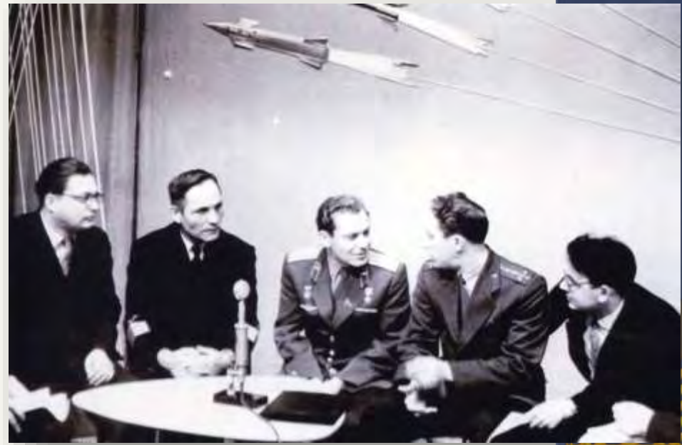
Встреча на телестудии, 1961 год