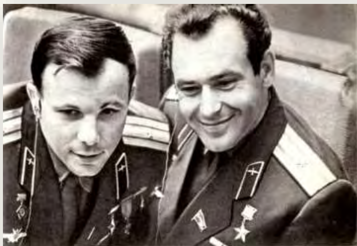
Звездные братья Титов и Гагарин