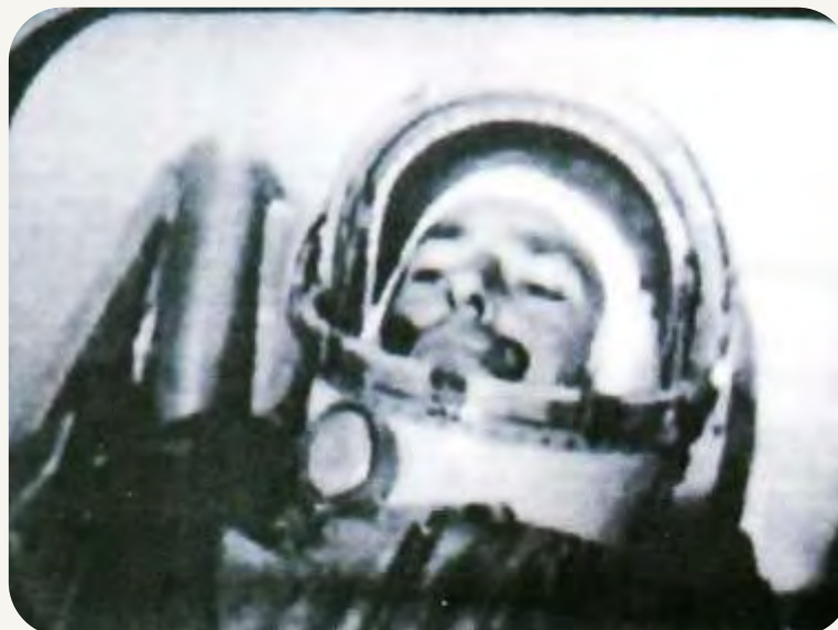
Телеизображение Г.С. Титова из космоса