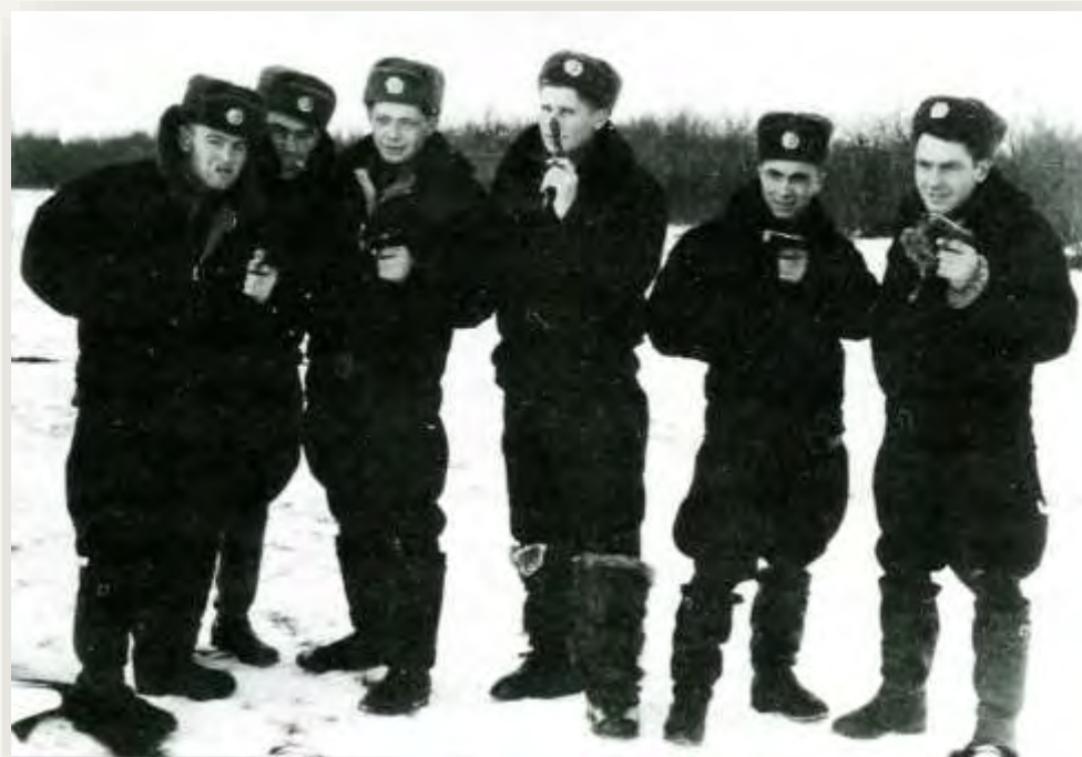
Лётчики Сиверского полка, 1958 год

В 1959 году Г.С. Титов был переведен в 103-й гвардейский истребительный авиационный полк 41-й истребительной авиадивизии 76-й воздушной армии Ленинградского военного округа.