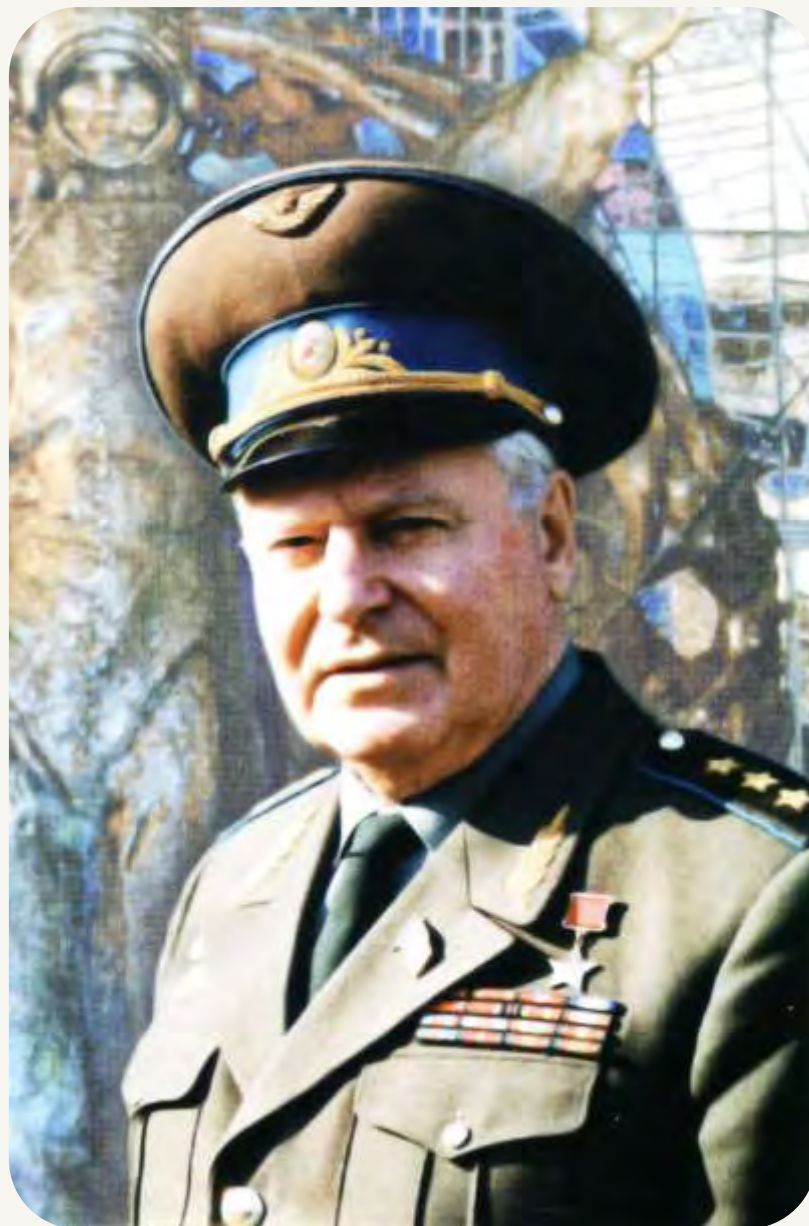
Летчик-космонавт СССР, Герой Советского Союза, генерал-полковник авиации Титов Герман Степанович