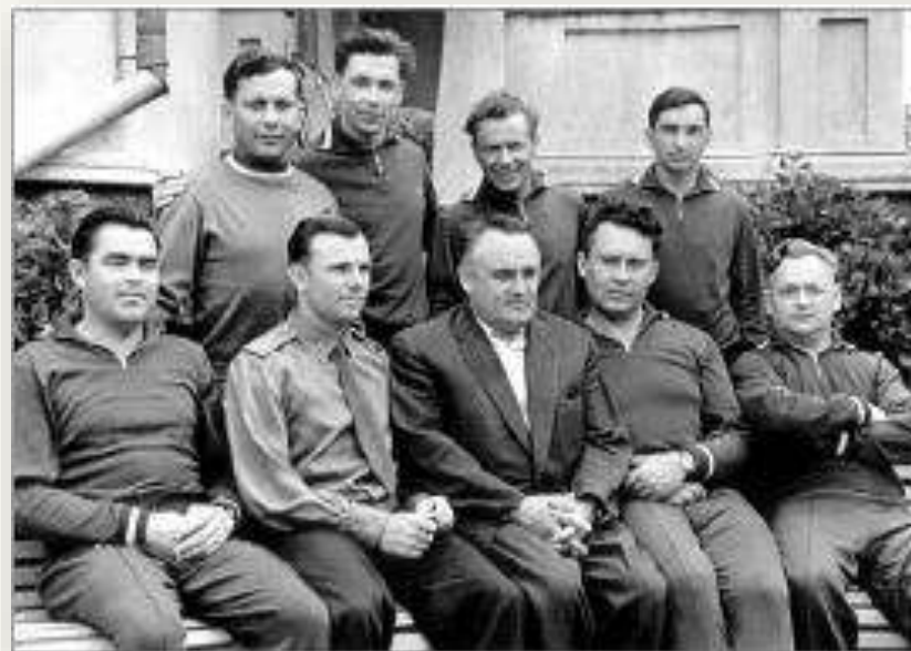
Сергей Павлович Королёв с членами первого отряда космонавтов