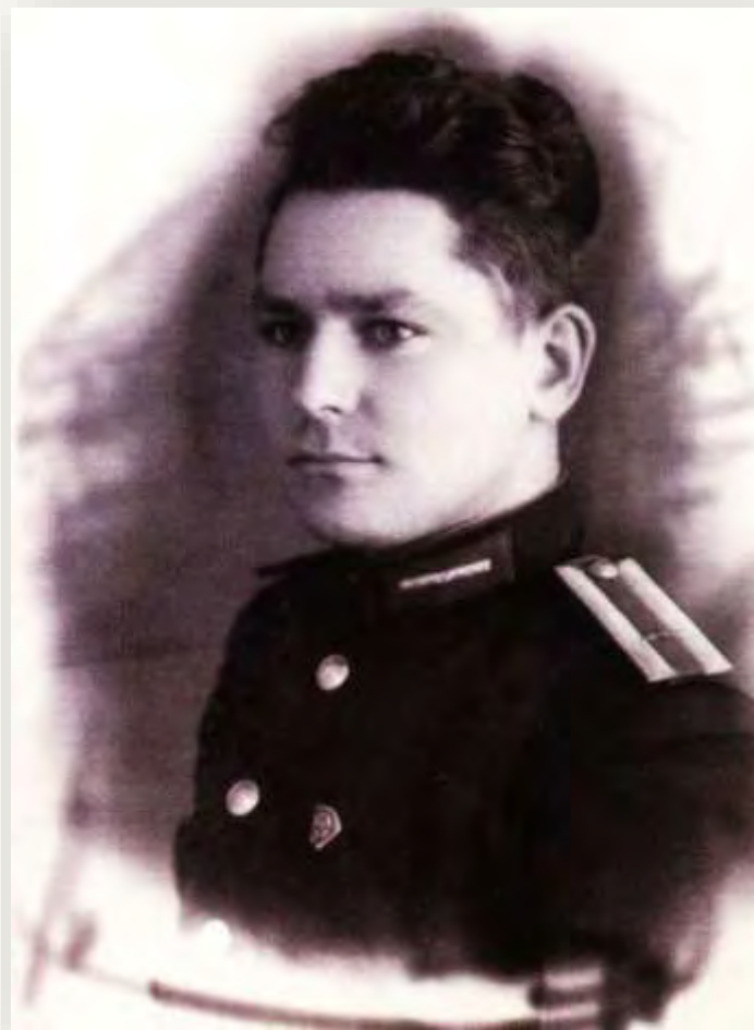
Герман Титов – курсант школы первоначального обучения лётчиков, КССР, Кустанай, апрель, 1954 г.

В 1953 году после окончания школы он поступает в 9-ю Военную авиационную школу первоначального обучения лётчиков (г. Кустанай, Казахской ССР).