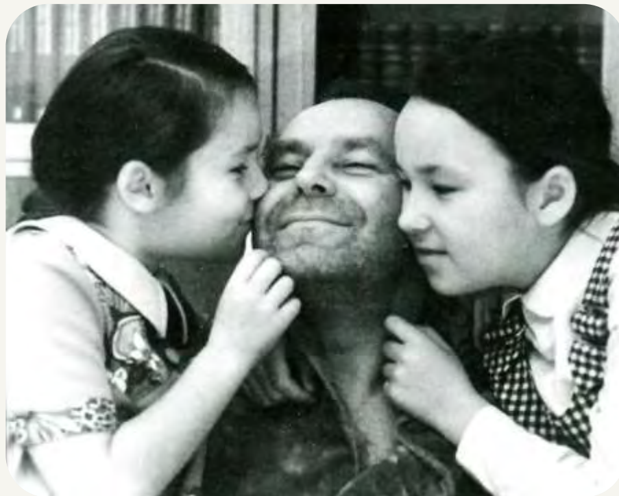
Дети с отцом, 1974 год