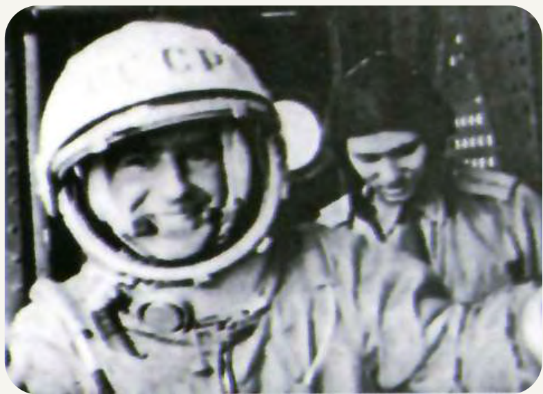
На верхней площадке ракеты

Научная программа полета была выполнена полностью. Герман Титов осуществил все необходимые операции по ориентации и управлению космическим кораблем, вел радиосвязь, фиксировал в бортжурнале показания приборов, экспериментировал с приемом пищи и сном в условиях невесомости. Впервые Г.С. Титов проводил киносъёмки Земли через иллюминатор корабля профессиональной камерой «Конвас».