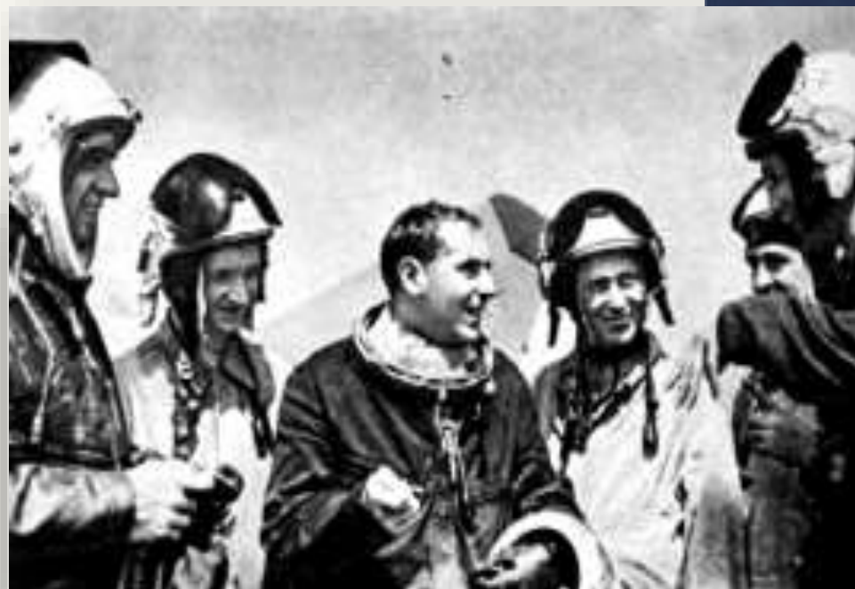
Сразу после приземления, 7 августа 1961 года