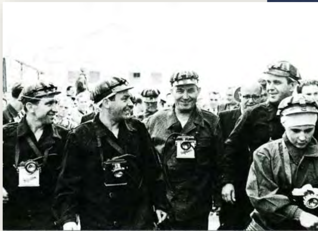
В гостях у шахтёров Донбасса, 1964 год