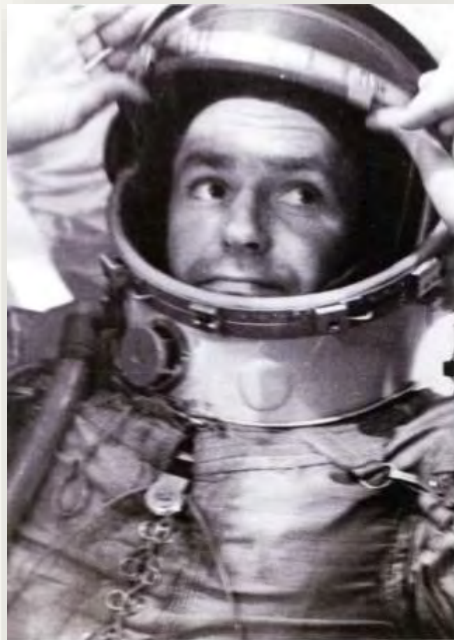
Перед стартом, 6 августа 1961 года

Этот полет длительностью более суток впервые в мире открыл для современной науки исторически важный факт: человек может не только путешествовать по космическим трассам, но и плодотворно трудиться на орбите.