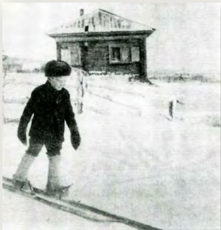
Герман Титов на лыжах, 1941 год

Герман Степанович Титов родился 11 сентября 1935 года в селе Верхнее Жилино, Алтайского края, в крестьянской семье.