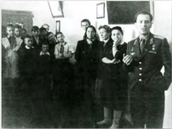
Выступление перед учениками Полковниковской школы, Алтайский край, 1961 год