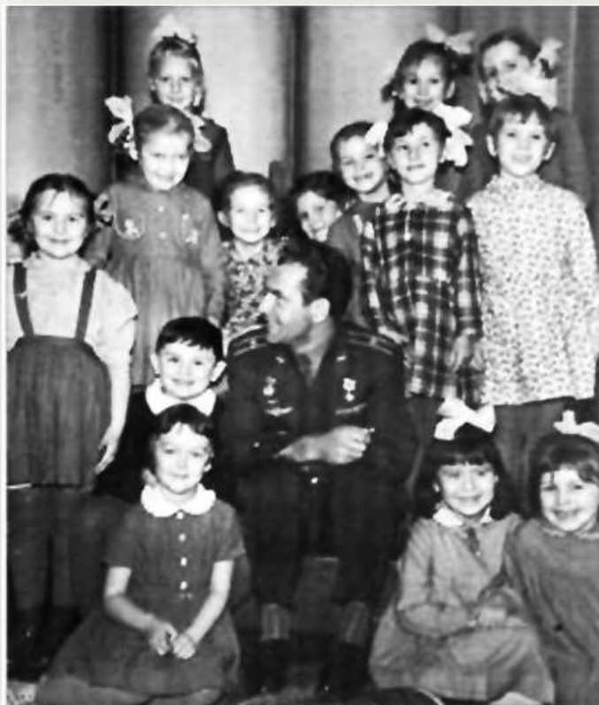
С детьми Косихинского района Алтайского края

Герман Степанович совершает множественные поездки по родной стране. И – там встречаясь не с президентами и премьер-министрами, генералами и учёными, а с сельскими тружениками, учителями, детьми – остаётся простым и порядочным человеком, помнящим своё не звёздное прошлое.