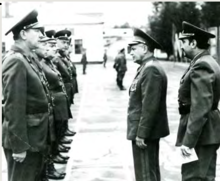
Генерал-полковник Титов прибыл в часть с проверкой

Да и сама должность заместителя командующего военно-космическими войсками страны обязывала его отвечать как за быт, досуг офицеров и рядовых солдат, так и за запуск ракет.