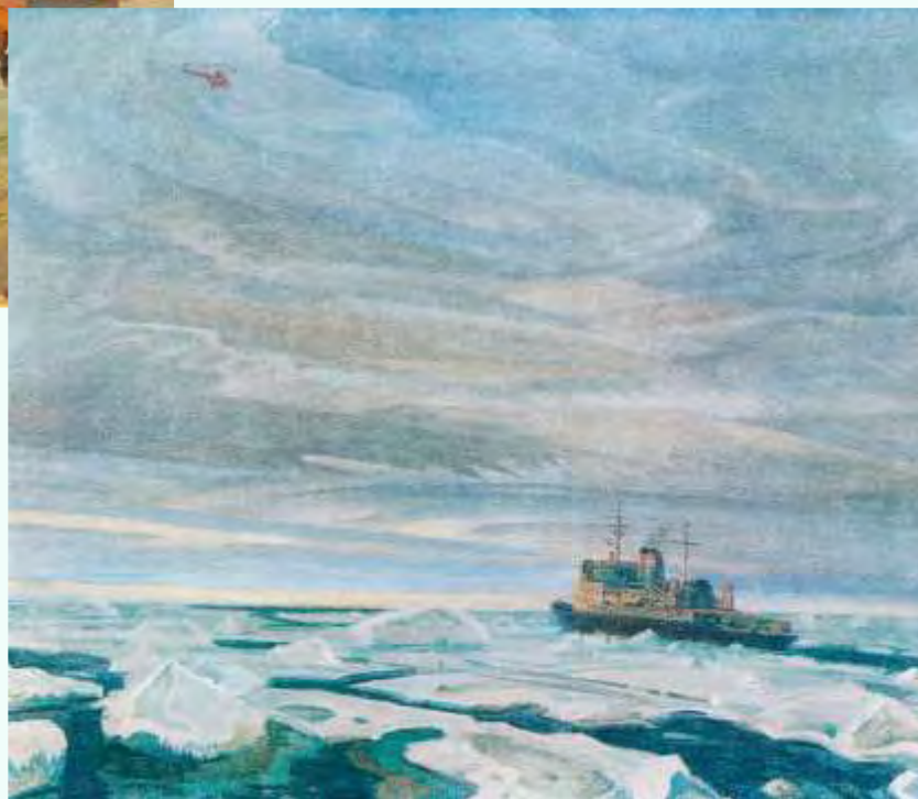
Торхов Ф. С. Адмирал Макаров в море Лаптевых. 1979. Холст, масло. 95 x 100 см (Местонахождение неизвестно)