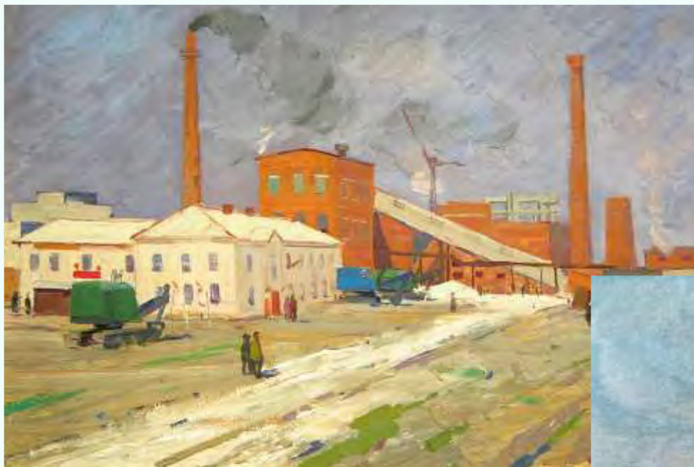
Торхов Ф. С. Кучукский сульфатный комбинат. 1964. Холст, картон, масло. 49,5 x 72 см (ГХМАК)

За 20 лет (60–80-е гг.) Ф. С. Торхов объездил не только Алтай, посещая стройки края, но был даже на Крайнем Севере.