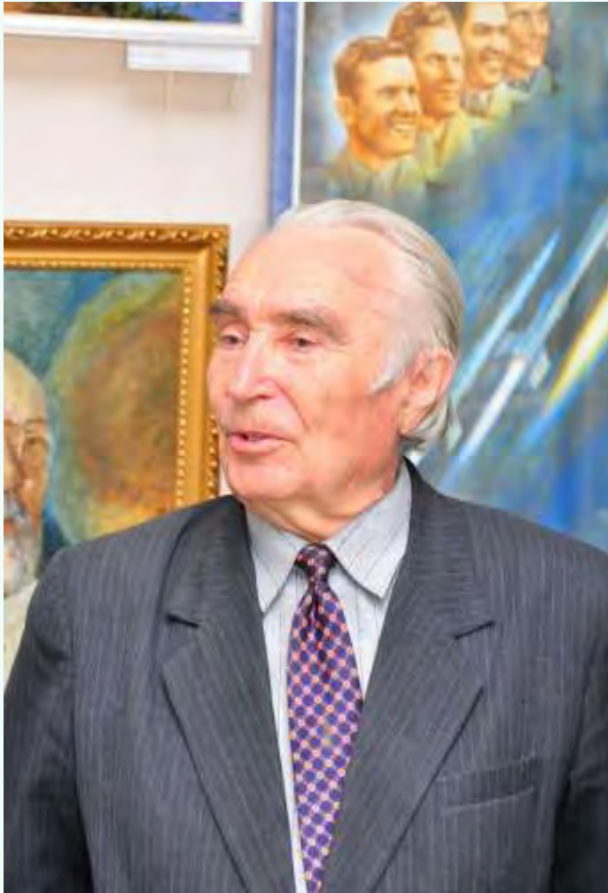
Фёдор Семёнович Торхов

Выдающийся алтайский художник, «народный дипломат», создававший и поддерживавший культурные связи между Россией и Монголией.