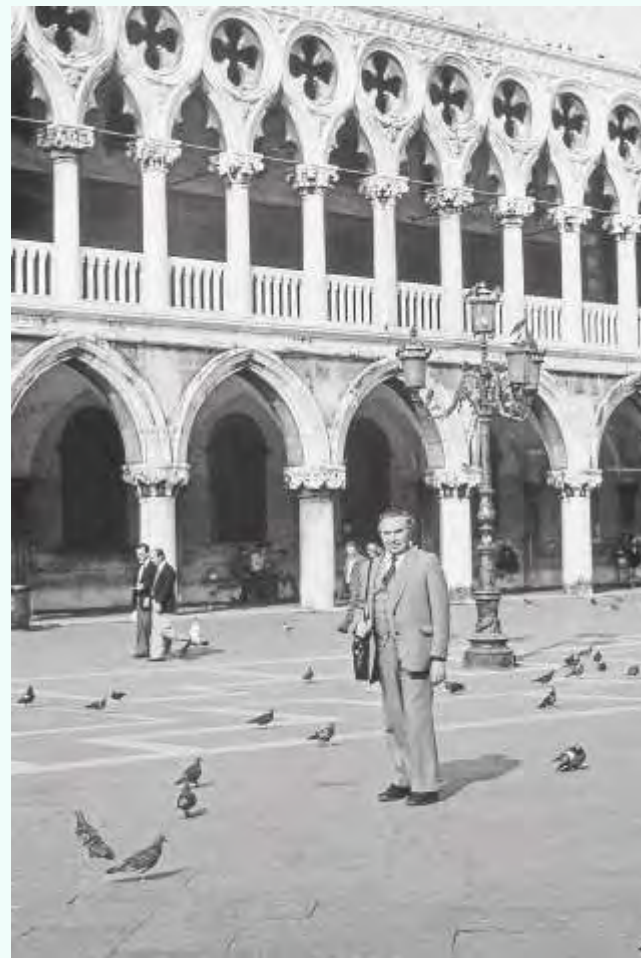
Ф. С. Торхов. Венеция. 1981 г.