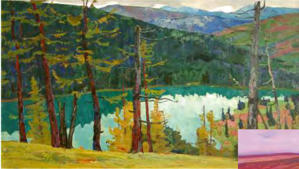
Торхов Ф. С. Тальмень-озеро. 1967. Картон, масло. 80 x 100 см (ГХМАК)