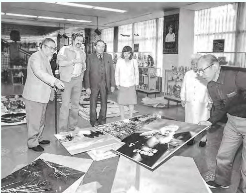
Осмотр выставочного зала. Саппоро. 1985 г.

В 1970–1980-х гг. произведения алтайских художников экспонировались в странах Восточной и Западной Европы, Южной Америки и Северо-Восточной Азии. Со своими картинами Фёдор Семёнович побывал в Италии, Японии.