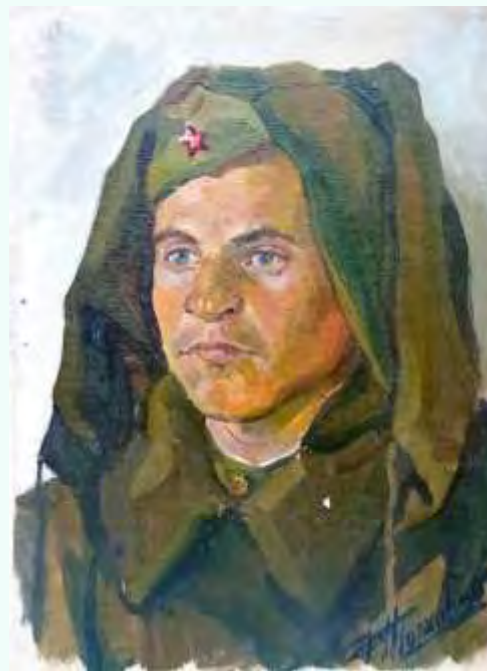
Торхов Ф. С. Портрет военного. 1953. Холст, картон, масло. 32,5 x 24 см(ГХМАК)