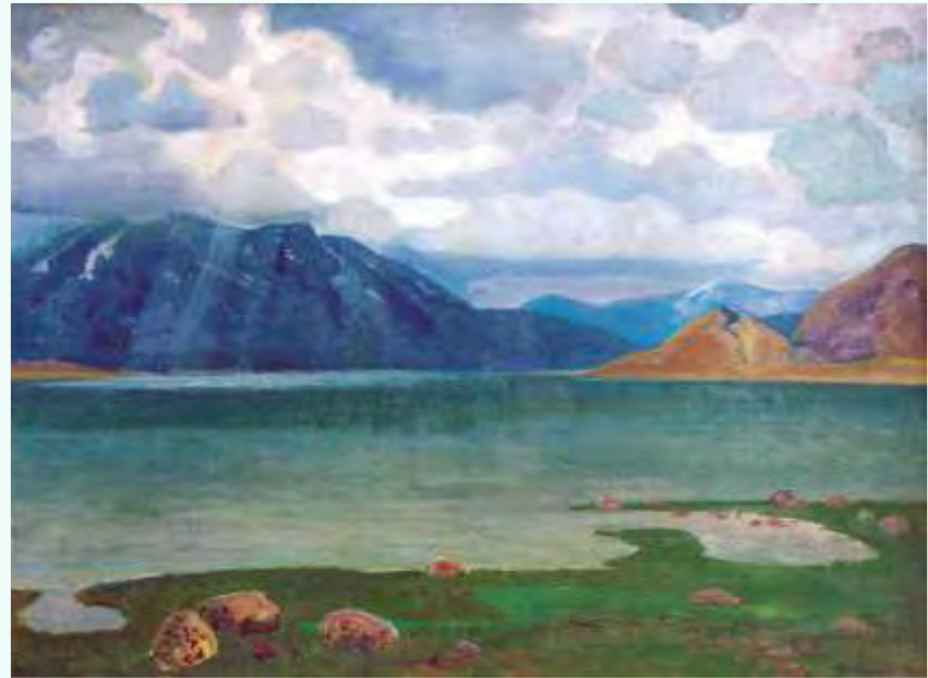
Торхов Ф. С. Хотон-Нуур. 1986. Холст, картон, масло. 60 x 80 см (Музей изобразительного искусства имени Занабазара, МНР)