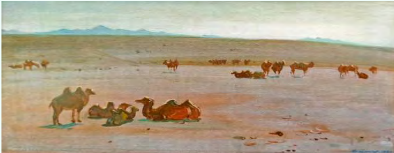
Торхов Ф. С. В Гоби. Мандах сомон. Монголия. 1982. Холст, картон, масло. 42 x 71 см. (Собрание семьи Щетининых)