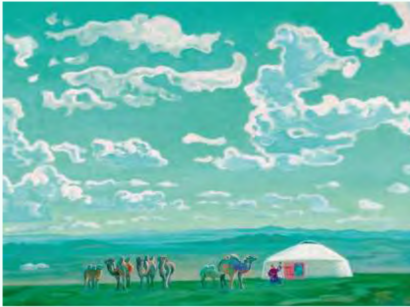
Торхов Ф. С. Гобийская песня. 1984. Холст, темпера. 114 x 124 см (Томский областной художественный музей)