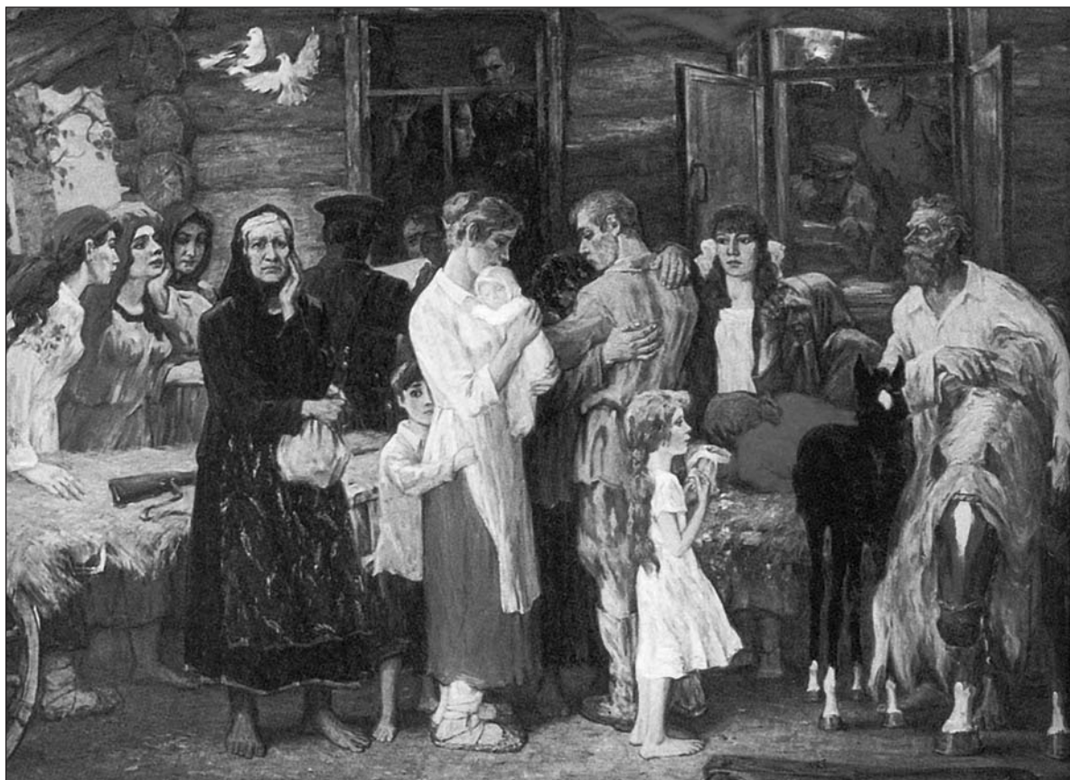
Хайрулинов И. С. Июнь сорок первого. Х., м. 186x258.

предприятия пищевой и деревообрабатывающей промышленности. Но самым главным условием успешного размещения эвакуированных предприятий было наличие развитой транспортной сети, связавшей Алтайский край накануне войны со всей страной.