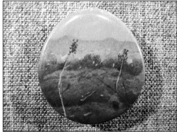
Причудливые рисунки на яшме заложены природой.