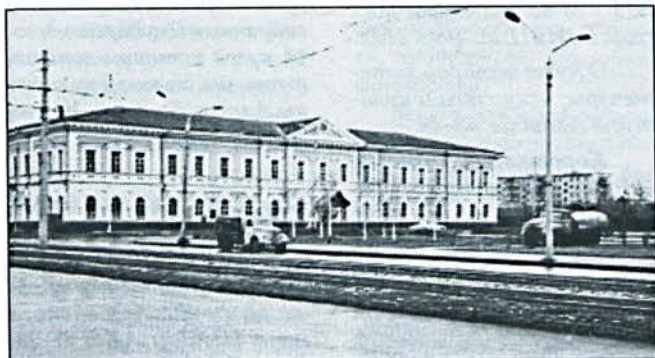
Здание горного училища, ул. Пушкина, 82.

со дня принятия Кабинетом решения об открытии в Барнауле горного училища