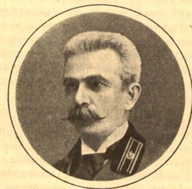
Константи́нъ Алекса́ндровичъ Смирно́въ.