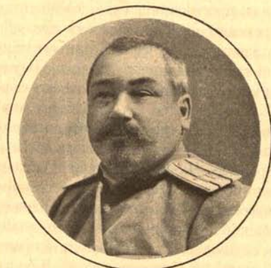
Петръ Семеновичъ Скварскій.