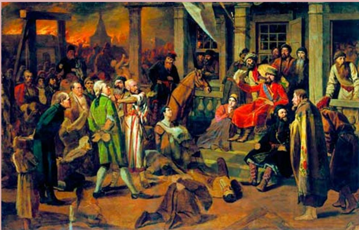
В. Перов. «Суд Пугачева». 1870-е гг.

Пушкин видит роковую неизбежность борьбы, понимает историческую обоснованность крестьянского восстания, отказывается видеть в его руководителях «злодеев». Но он не видит пути, который от идей и действий любого из борющихся лагерей вел бы к тому обществу человечности, братства и вдохновения, туманные контуры которого возникали в его сознании.