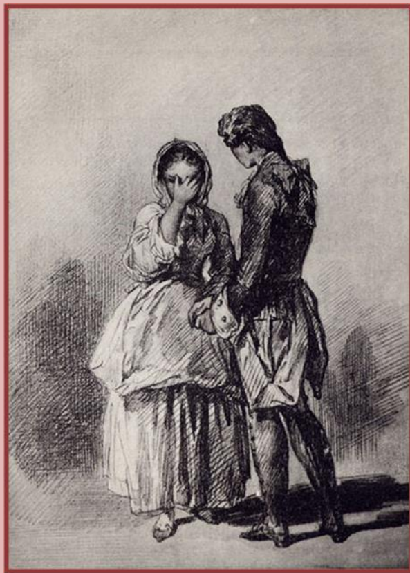
Маша Миронова и Петр Гринев. Рисунок П. П. Соколова.