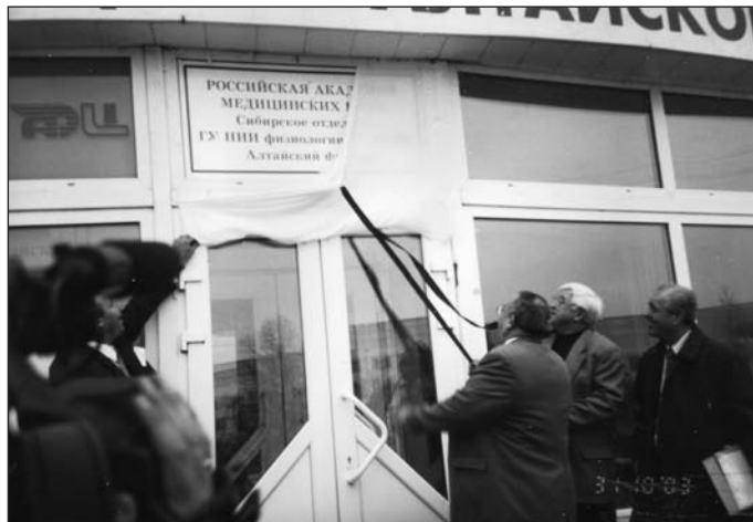
Открытие Алтайского филиала ГУ НИИ физиологии СО РАМН.