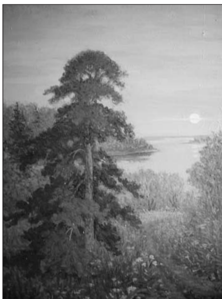
Хороши вечера на Оби 85x70 х., м. 2006 г.

И не случайно, что в 1993 г. М. И. Карпилов был рекомендован в члены Союза художников России такими ведущими живописцами, как народные художники России А. П. Левитин и Ю. П. Кугач, заслуженный художник России Ф. С. Торхов.