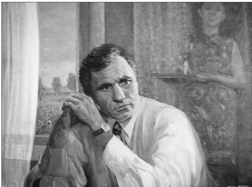
Раннее утро. Портрет В.М. Шукшина 86x68 х., м. 2004 г.