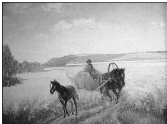
Алтайское поле 100x80 х., м. 2007 г.