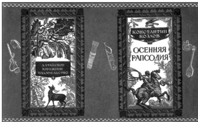
Лупачев Б. Н. Обложка к сборнику стихотворений К. Козлова «Осенняя рапсодия». Ксилография. 23x14,5.

На протяжении долгих лет Б. Н. Лупачев занимается педагогической деятельностью. С 1974 г. он преподавал в Новоалтайском художественном училище (НГХУ). Б. Н. Лупачев писал себе: «После открытия в Новоалтайске (в 15 километрах от Барнаула) художественного училища возникла острая необходимость в преподаватель-