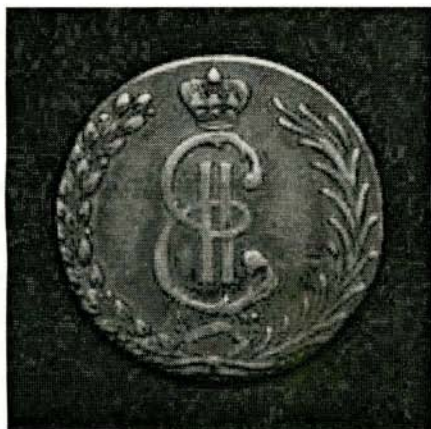
Монета сибирская номиналом десять копеек. Год выпуска 1779 г. Из частной коллекции.

Жарким июньским днем в лето 1766 г., в новую крепость, что встала в сибирской глубинке на берегу реки Сузун, из Барнаула прибыла большая группа горных офицеров и окружного начальства. Предстояло открытие нового монетного двора Кабинета ее императорского величества. Отстояли молебен, священники из главного барнаульского храма Петра и Павла окропили святой водой все строения и станы. По приказу начальника двора подняли створы на шлюзовых прорезях, и вода, разгоняясь по желобам, ударила в рабочую плоскость колес, давая ход всем работам. Встали по местам горные офицеры, надели кожаные фартуки подневольные слесари и кузнецы, завод загудел своими печами и задымил трубами. Как только в ход пошли станки, сразу провели первый опыт, перечеканив в монету 136 пудов меди.