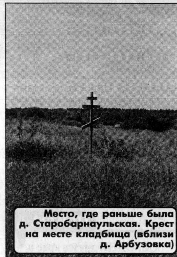
Место, где раньше была д. Старобарнаульская. Крест на месте кладбища (вблизи д. Арбузовка)