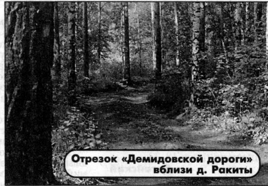
Отрезок «Демидовской дороги» вблизи д. Ракиты

На исходе дня, в час предзакатный, вышел я на кромку бора, отступившего от Барнаулки к самому краю песчаных дюн. Не так уж и безжизненна обезлюдившая местность: вон след лося на плотном песке, вон крестовидные следы какой-то птицы, по брошенной дорожке змея проползла... Взглянул в сторону истока реки - там вечерняя