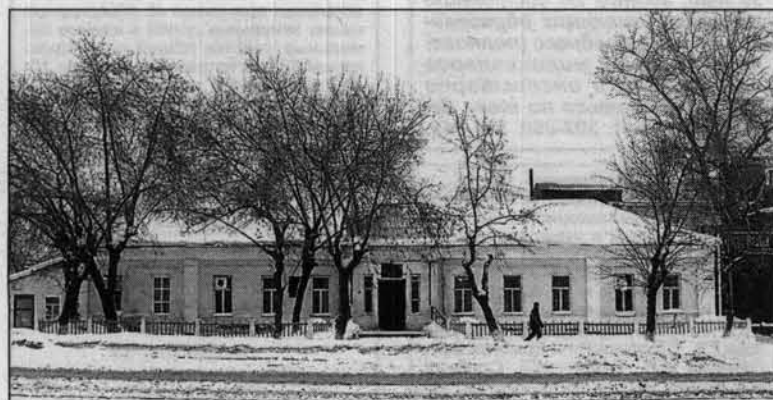
А это первое в Барнауле каменное здание - бывшая горная аптека.