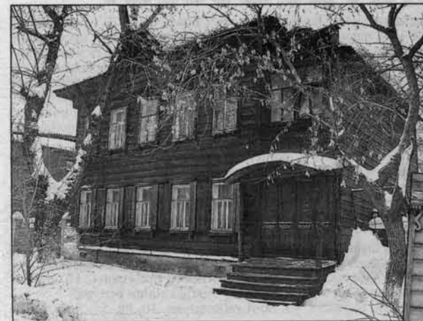
Все как положено: парадное крыльцо с навесом, окна с наличниками и створчатые двери.

- К счастью, да. Он входит в "петербургский" ансамбль на улице Ползунова. Когда-то, в XVIII веке, в нем размещалась заводская канцелярия, а потом - та самая библиотека, с которой и начиналась наша "шишковка". Вы могли обратиться на этот дом внимание из-за бельведера, венчающего здание, построенное в строгих традициях классицизма. Правда, с года-