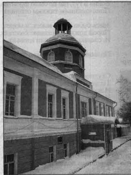
Эхо Петербурга в Барнауле - дом с бельведером на ул. Ползунова, бывшая Канцелярия Кольвано-Воскресенских заводов.