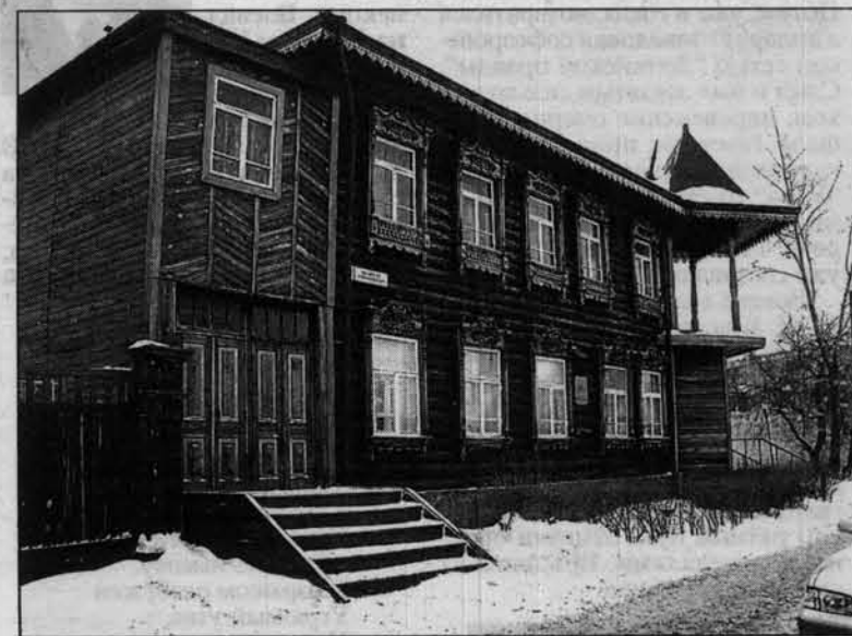
В этом доме с двумя парадными на углу Никитина всегда была аптека.

лестницей. А порой заколачивали парадную дверь и просто так, из принципа. И с тех пор так и ходят часто через черный ход!