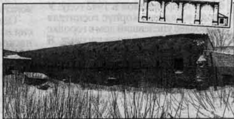
Важня в проекте Молчанова и сегодня.

А у нас сохранилось заводское здание, построенное в XVIII веке. Это явление уникальное для всей Сибири. Вслед за Уралом в Барнауле был создан художественный образ промышленных сооружений в формах русского классицизма. Когда-то заводской ансамбль напоминал римские сооружения - монументальными фасадами плавильных фабрик, мощными аркадами стен, обращенных к плотине. Сегодня о былом великолепии напоминает здание, в котором взвешивали руду, которую везли из Змеиногорска. Это важная открытая галерея в стиле классицизма. Построили ее в 1780 году. Вплоть до середины прошлого века важна сохраняла первоначальный вид, но в начале 60-х здесь разместили ПТУ, проемы заложил кирпичом. Потом в галерею устроили общежитие спичфабрики. Но при желании новых хозяев фабрики обезобра-