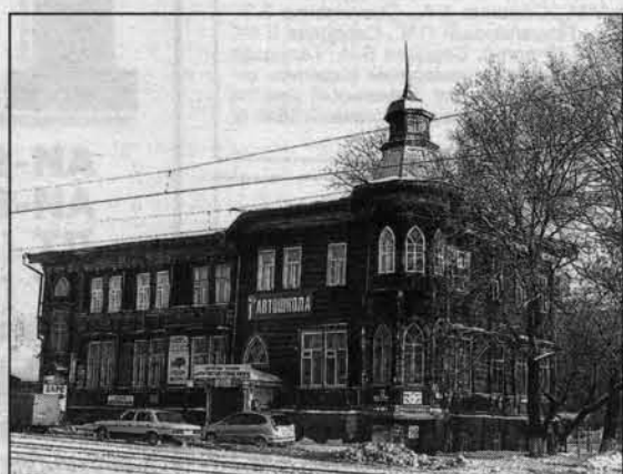
В начале века здесь находилась частная гимназия Марии Будкевич.