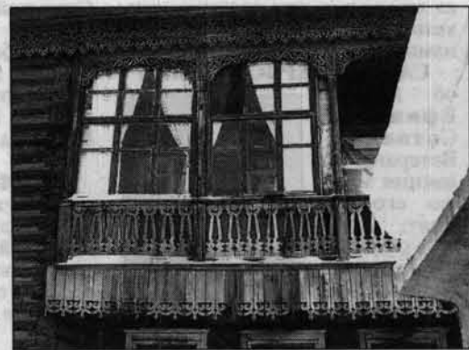
Первая в Барнауле лоджия.

Вы абсолютно правы - все это, этот дух времени, пронзает душу и остается с вами навсегда. Я бегала в детстве в чудесную библиотеку. Мне страшно нравились и само здание, и двери с литыми ручками, и чугунная лестница барочного типа - она как бы расходилась внизу в две стороны. Там были высокие-высокие потолки и большие окна, и поэтому всегда было много солнца - на стенах, на книжных полках, на полу.