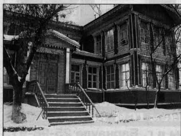
Бывшая заводская чертежная. Дом построен в традициях городской усадьбы XIX века (ул. Ползунова).

Почему сливочного? Она была очень бурной тогда и поднимала со дна мириады песчинок - они-то и придавали воде желтоватый цвет. Да, не удивляйтесь, наша речка бурной была и полноводной - не было ни одной весны, чтобы кто-нибудь не утонул в ней. А берега ее были в зарослях черемухи, и на выпускном вечере вся школа утопала в черемухе. Ведро везде стояли в классах - ни в какие вазы она не помещалась. Мальчики бегали на речку и охапки целые приносили учителям.