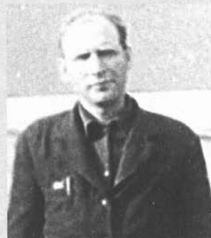
И.А. Ермаков. Первоцелинник п. Заводской.