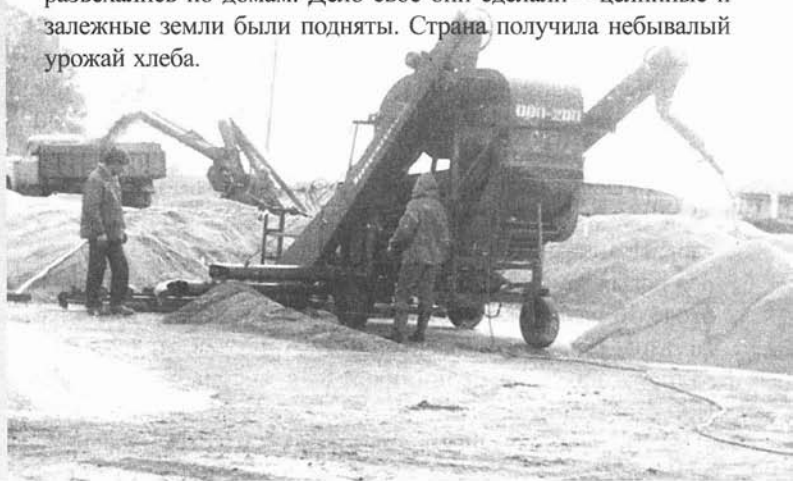
Очистка зерна после комбайна на току в селе Черемшанка.