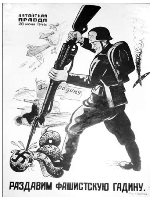
Плакат. Рисунок барнаульского художника И. Е. Харина.