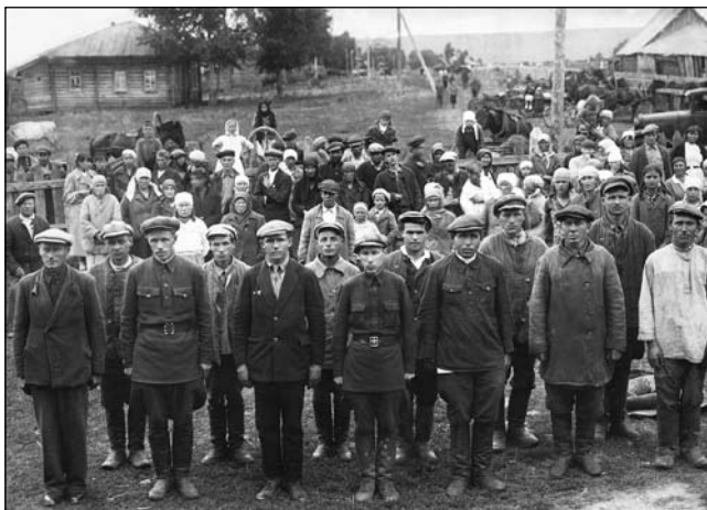
Проводы на фронт в с. Тогул Тогульского района. 1941 г.

Осенью 1941 г. из западных районов страны прибыло 57 госпиталей. Только в Барнауле были дислоцированы 16 эвакогоспиталей на 5050 коек. В связи с возрастающими потребностями армии и страны в медицинских работниках уже в августе 1941 г. в крае было создано 12 курсов медицинских сестер и 176 са-