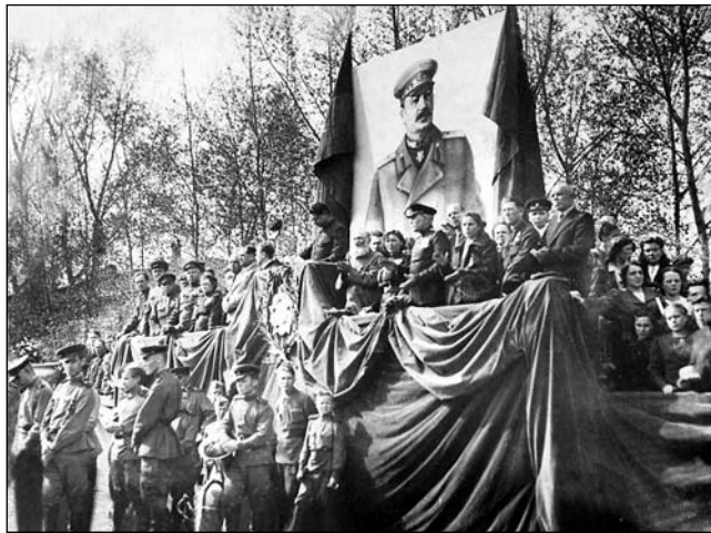
Митинг в День Победы на площади Свободы. Барнаул. 9 мая 1945 г.