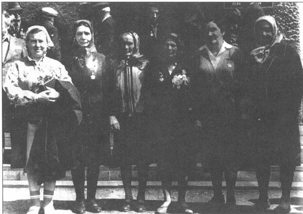
Женщины – участницы Великой Отечественной войны 1941–1945 гг., с. Курья, 9 мая 1996 г.