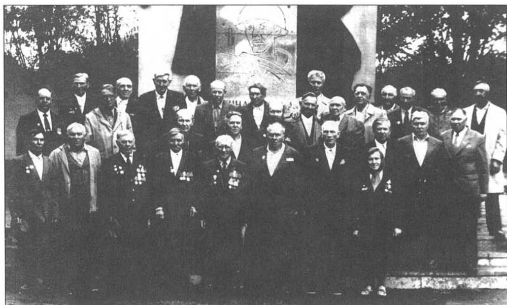
Встреча ветеранов — участников Орловско-Курской битвы, с. Курья, июль 1993 г.