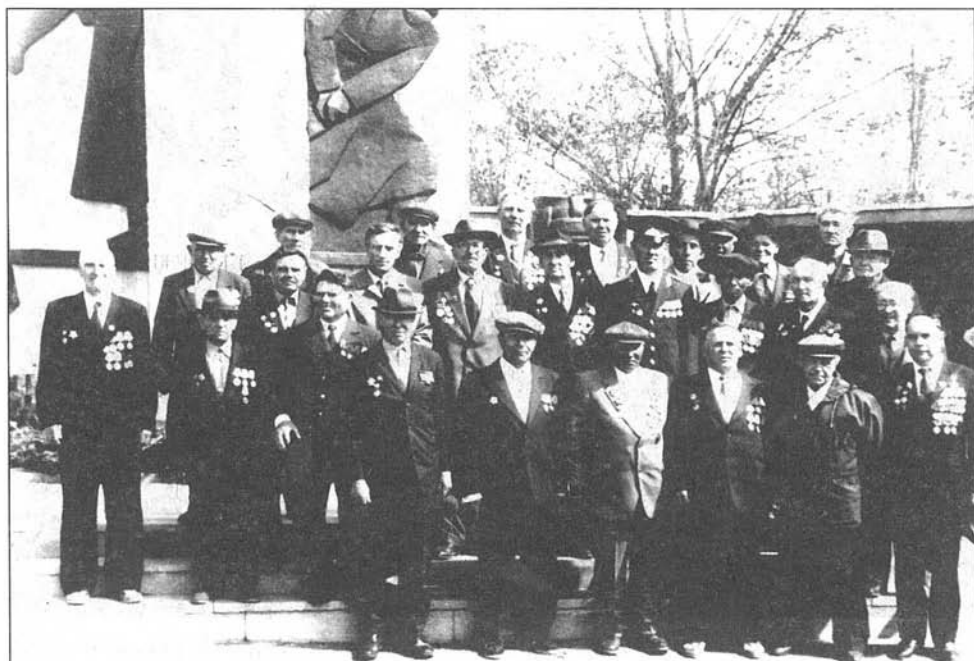
Ветераны Великой Отечественной войны 1941—1945 гг., с. Курья, 8 мая 1990 г.