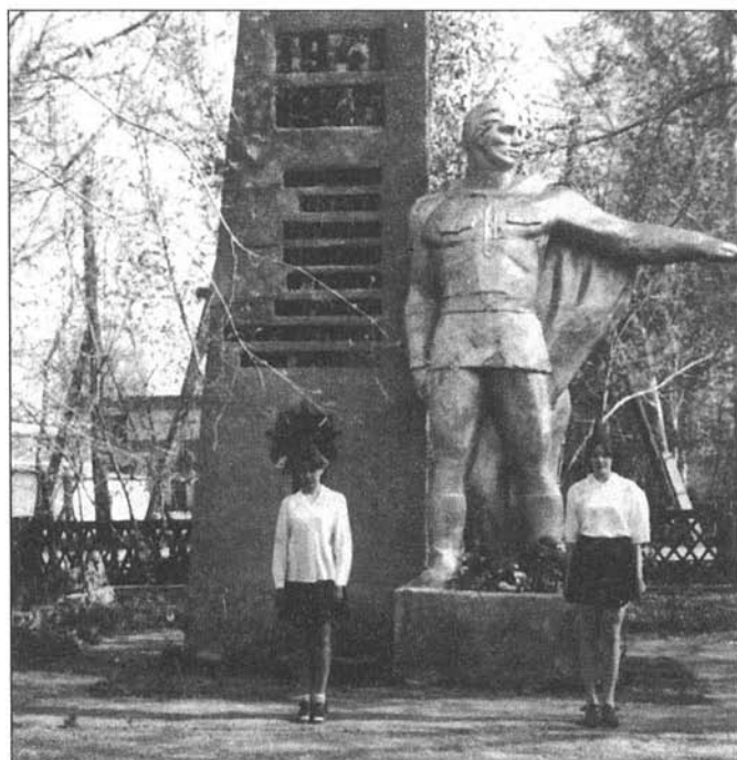
Почетный караул у памятника погибшим в годы Великой Отечественной войны, с. Ивановка, 9 мая 2000 г.