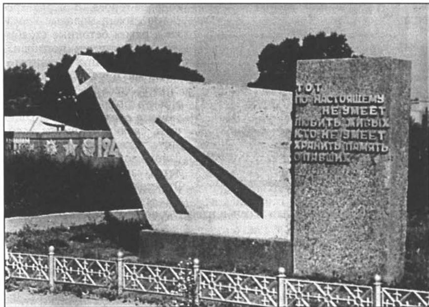
На мемориальном комплексе.

Автор раздела «Основные веки истории» И.М. Хохлов.